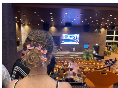
Duborg-Skolens 10. årgang er blevet klædt på til det amerikanske valg, som de fulgte med i på skolen natten til onsdag.