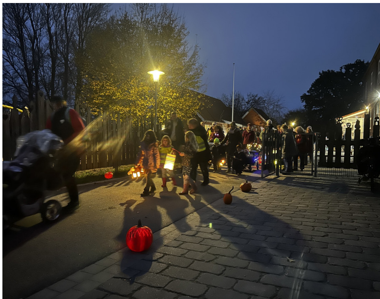
Det lignede en helt almindelig lanternefest, da 130 store og små begav sig ud i optøget. Det var det også – men med skjulte udfordringer.

- Så er det jo godt, man har flere kasketter, sagde den første Silke, som