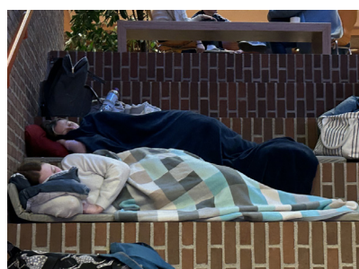
Der var både politisk spænding(er) og planlagte aktiviteter, men alligevel var det ikke alle, der kunne holde sig vågen hele natten.