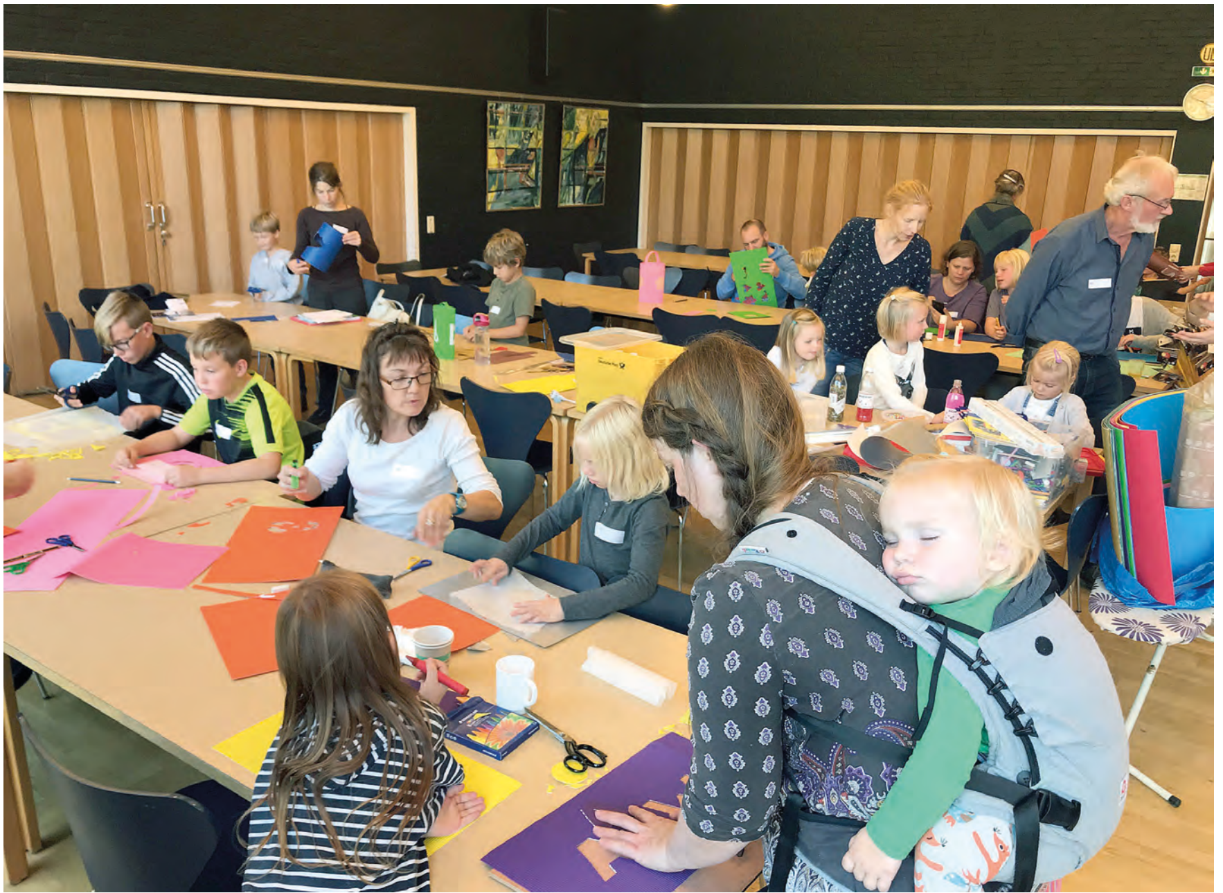
Børn og voksne var sammen på tværs af alder og køn på efterårets Sprogfestival på Christianslyst i oktober. Gennem samvær og aktiviteter stiftede familier fra Danmark og Sydslesvig bekendtskab med hinandens sprog og kultur.