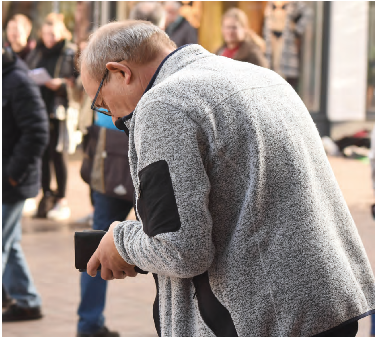
Eleverne samlede penge på gågaden i Flensborg.