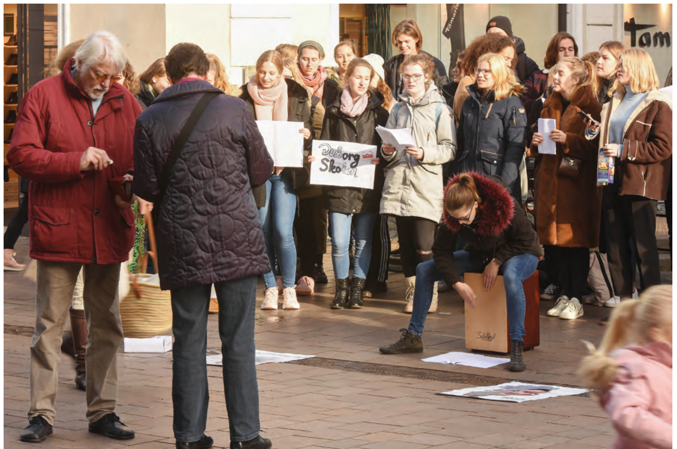
Sidste år samlede Operation Dagsværk 37.000 kroner i Sydslesvig.

dSydslesvig har samlet sammen i år er ikke gjort op endnu.