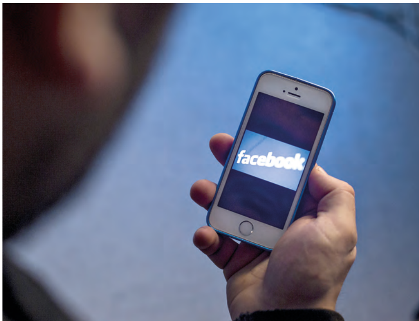
Undersøgelse om børn og datasikkerhed.

Mind Me-kampagnen er særligt målrettet de 13-19-årige. Den bæres i høj grad af de unge selv, da den blandt andet vil bygge på unges historier og erfaringer med it-sikkerhed gennem en YouTube-konkurrence. Kampagnen vil også involvere film, et nyt mindme.sti.dk