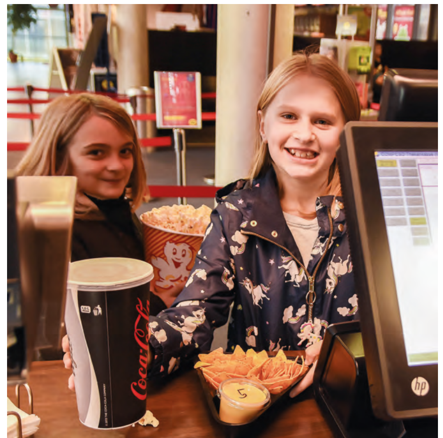
Blandt andet popcorn sørgede for den rigtige biografstemning.

i biografer over hele Danmark og i Sydslesvig. Hos os blev der vist film i Husum, Rendsborg, Slesvig og Flensborg. Filmene er målrettet enkelte aldersgrupper, og der stilles undervisningsmateriale til rådighed, så man hjemmefra kan forberede sig på filmene.