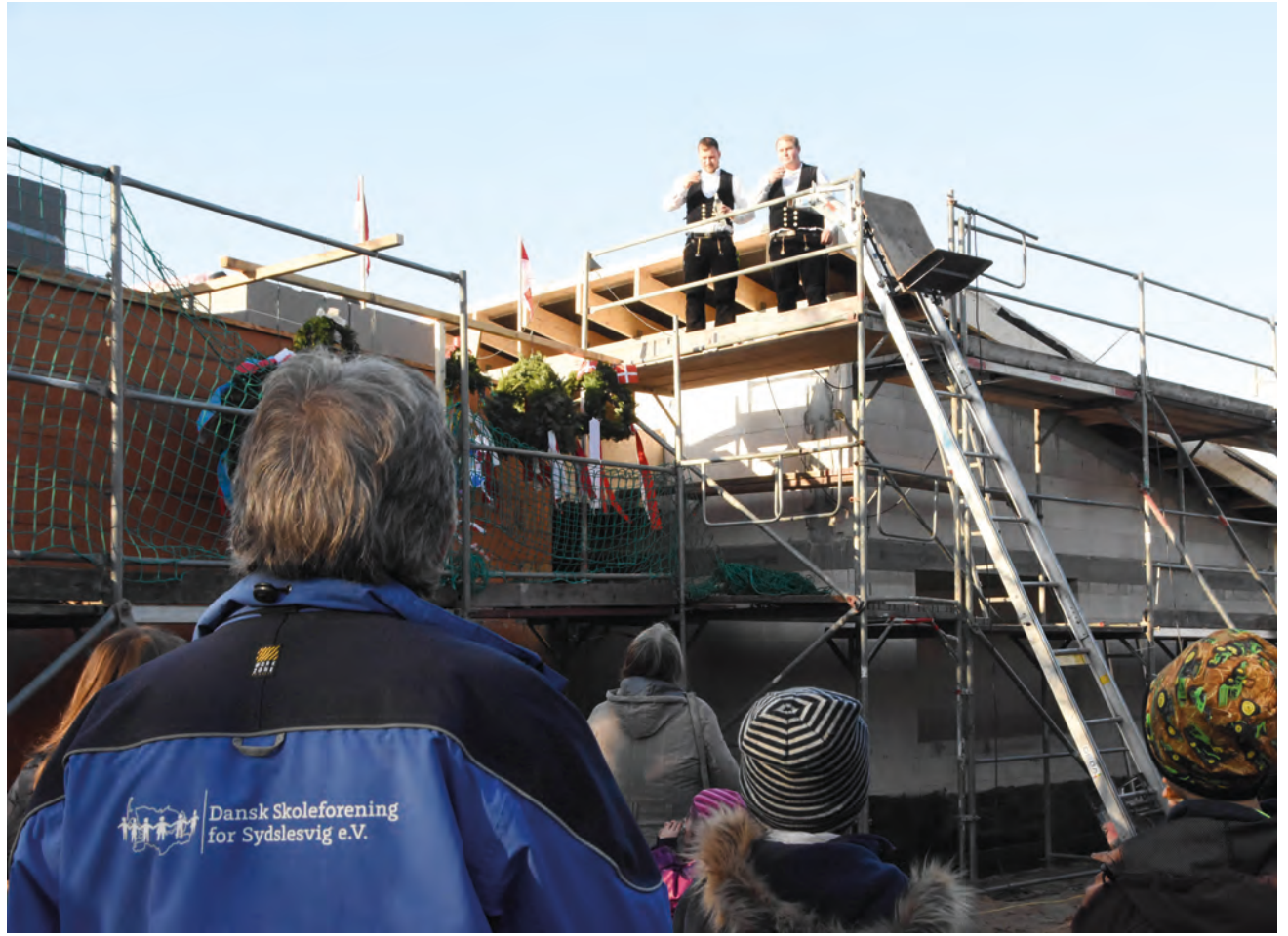
Håndværkerne drak på dagtilbuddets fremtid.