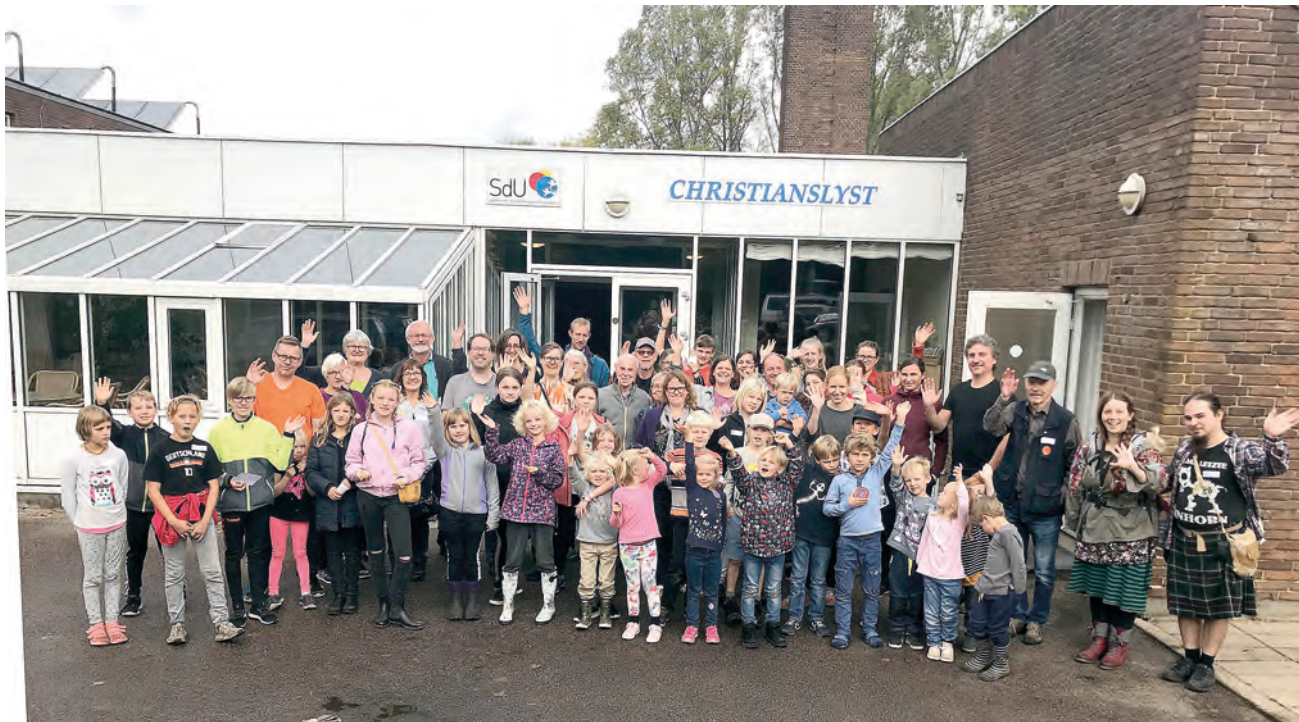
Godt 60 kursister havde meldt sig til Familie-sprog-festival med tandemprogkursus dansk-tysk. Tandem er en indlæringsform for sprog, for personer med forskelligt modersmål. Man skal arbejde parvis sammen for at lære hinandens sprog og talemåder.

- Tyskerne er høflige og danskerne er afslappede, siger de samstemmende og smiler.