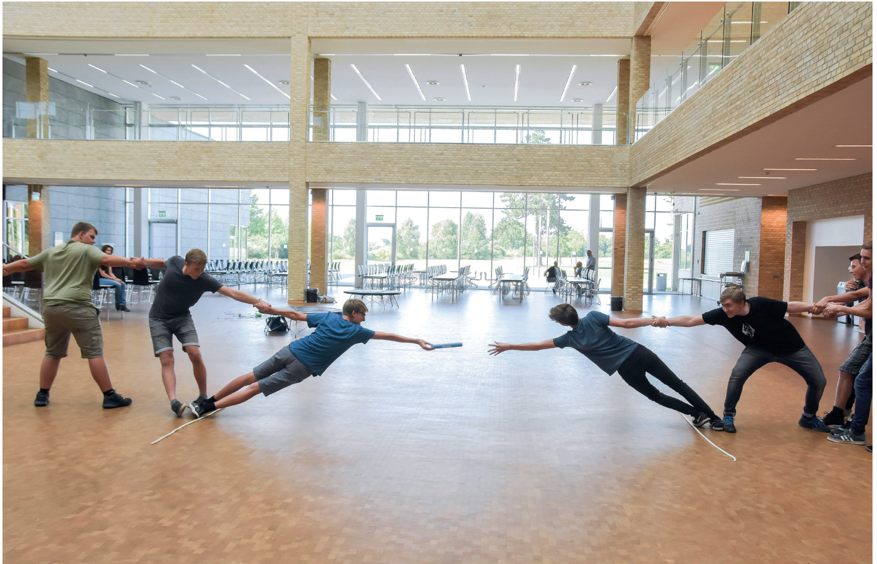
I introugen på A. P. Møller Skolen handler det om alt andet end undervisningen.

Når eleverne starter i 11. Klasse på skolen første skoledag, deltager de en hel uge i et opstartsforløb under