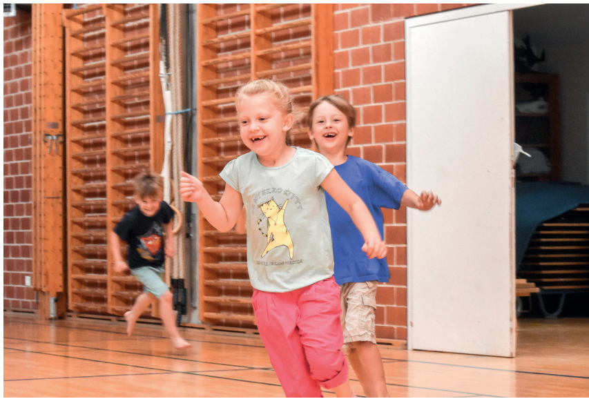
Børnehavebørnene er hver uge på besøg på skolen.

- Børnene får derigennem med, hvad der sker på skolen. De møder