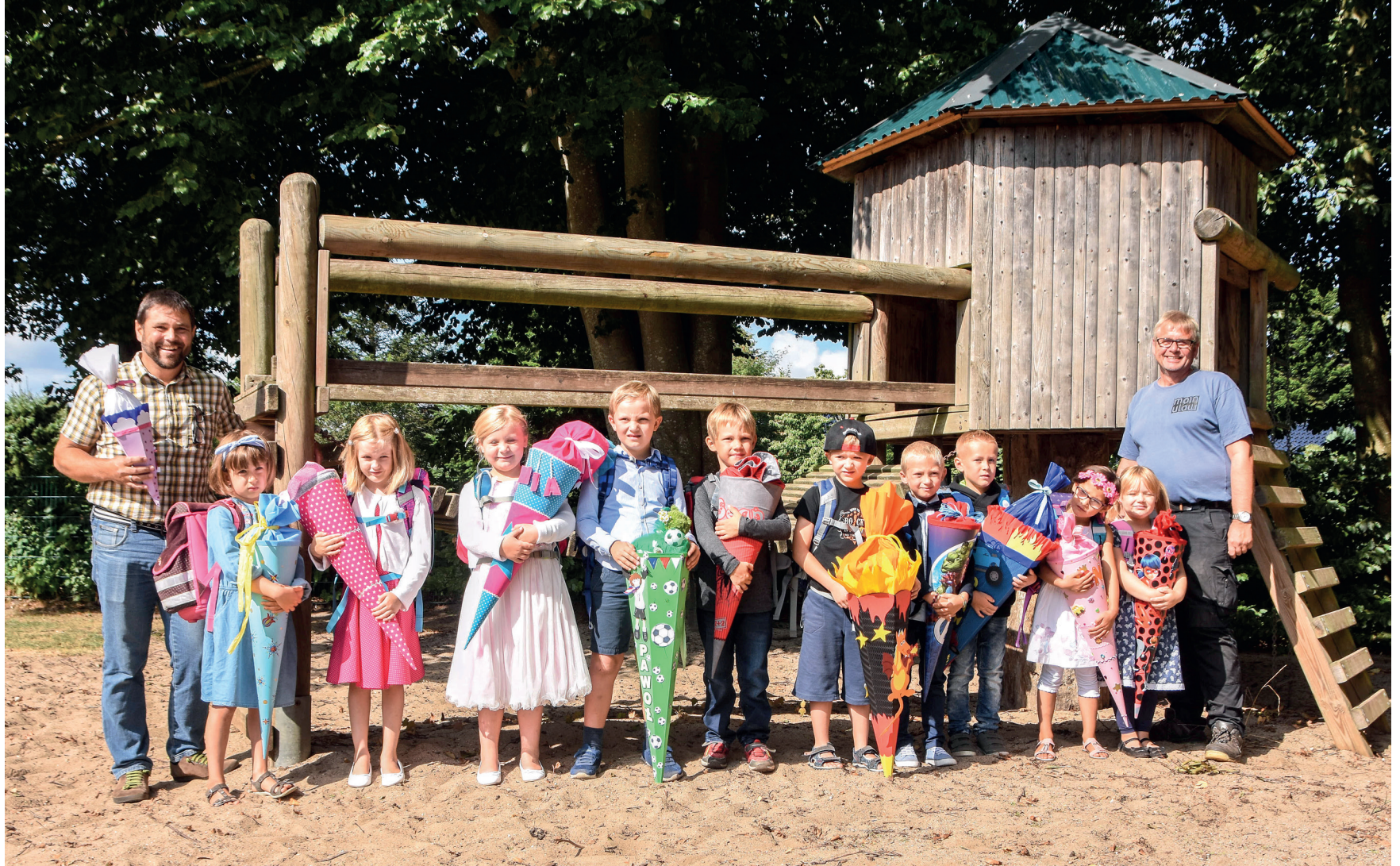
Ti nye elever, en ny skoleleder og en ny pedel i Store Vi-Vanderup Danske Skole.

- Indskoling er en overgang, og uanset hvor meget vi gør for at gøre den så nem som mulig, er det noget nyt. At et barn kommer i skole, betyder altid, at det tager mere ansvar. Det er faktisk nemt for barnet, men det er ikke lige så nemt for den, der