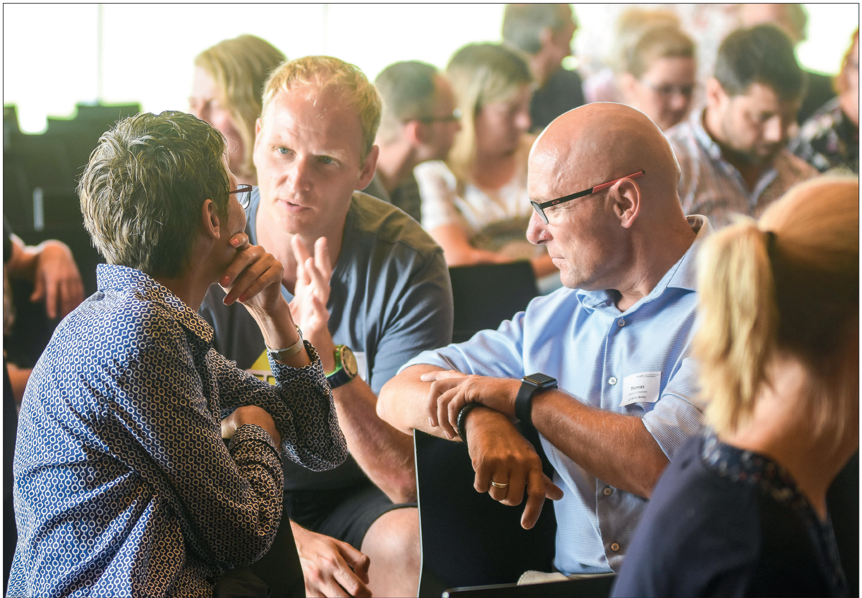
Summøve under oplægget om evalueringskultur og trivselsmålinger.