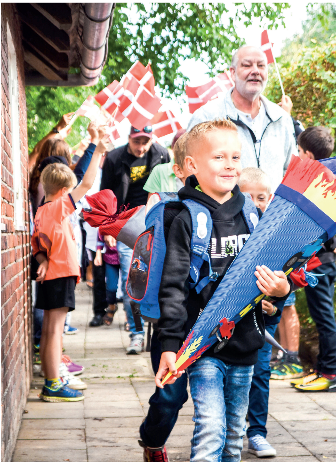
Første skoledag i Store Vi-Vanderup Danske Skole.