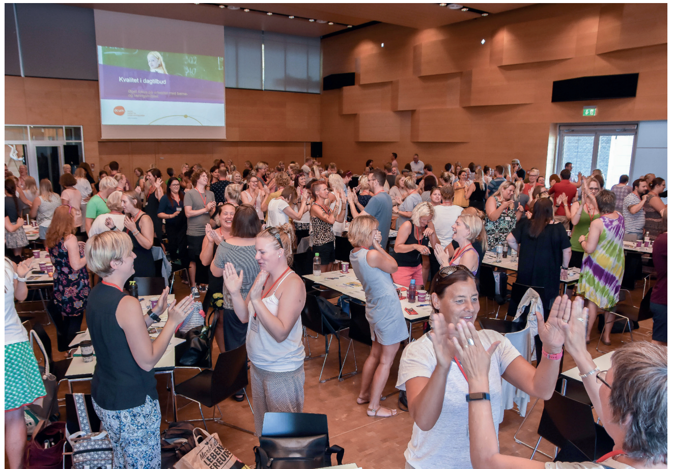
De pædagogiske dage sætter hvert år skub i børnehaveåret.

dagtilbuddet skal i samarbejde med forældrene give børn omsorg og