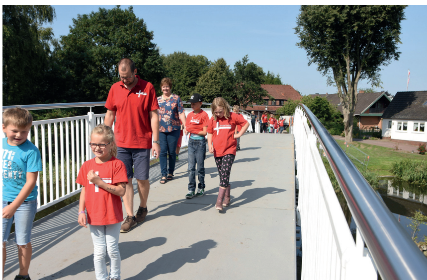
En tur hen over Ejderen