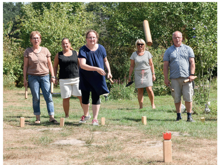
Pædagogerne afprøvede forskellige udendørs- og naturlege.

Vækstmodellen tager afsæt i den positive psykologiske tænkning og