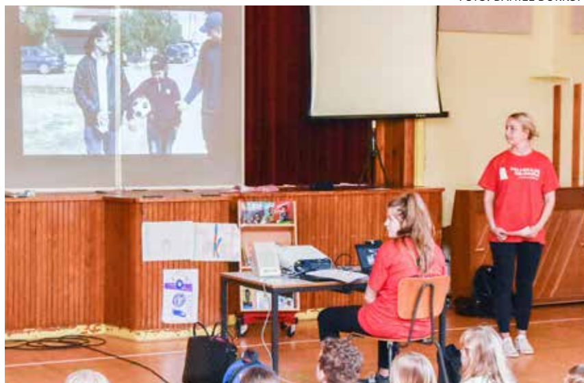
Børnene fra Sørup og deres kammerater fra Satrup lyttede til fortællinger fra Jordan