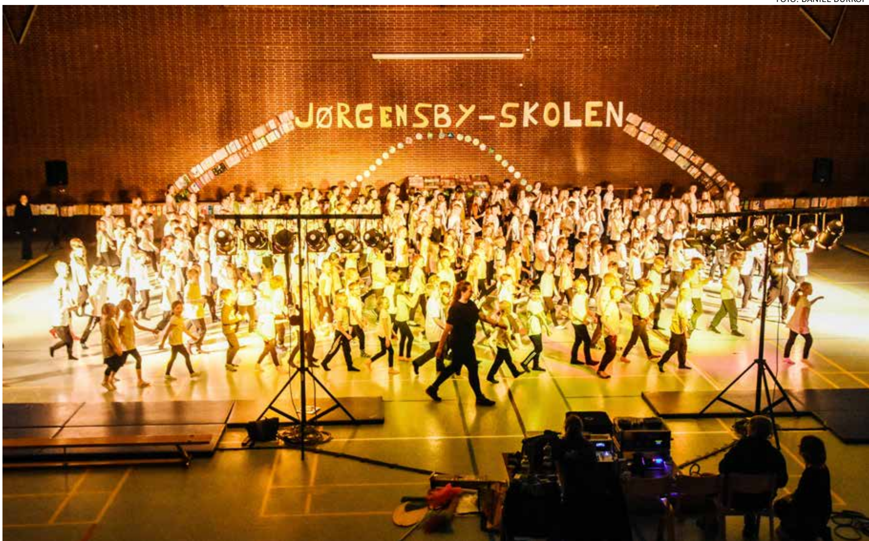
Der var udsolgt til Jørgensby-Skolens danseshow i idrætshallen.