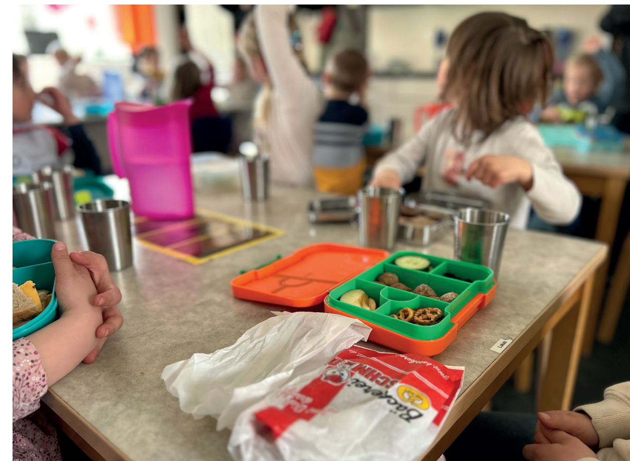
Det er rigtig rart at være i børnehaven i Kappel til spisetid. Men sådan har det ikke altid været.