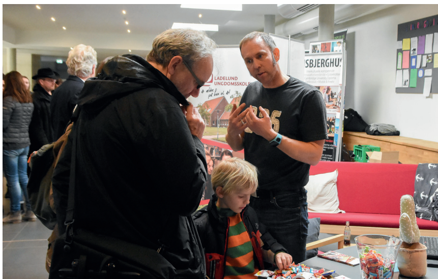
Ladelund Ungdomsskole er efterskolen i Sydslesvig