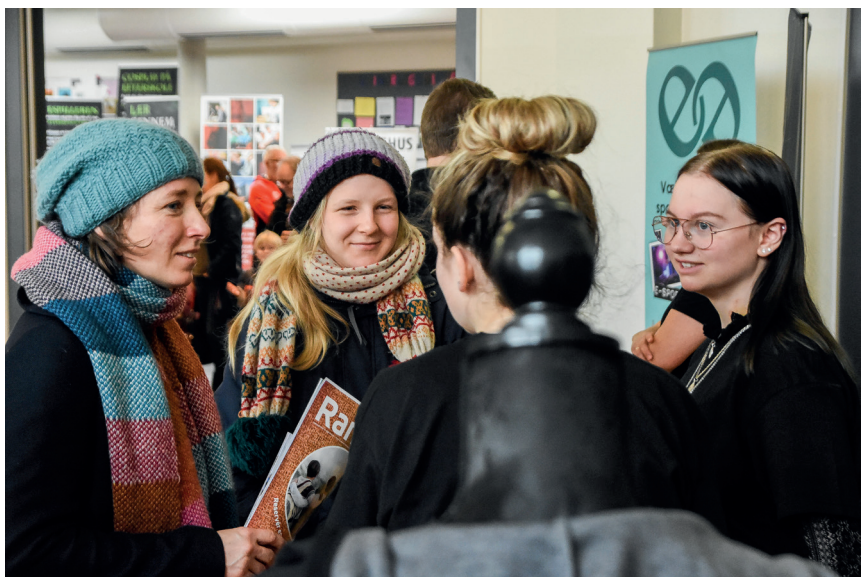
Flere hundred interesserede mødte op.