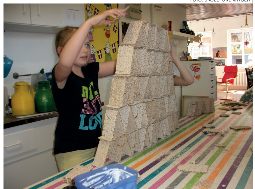
De unge stablede knækbrød...