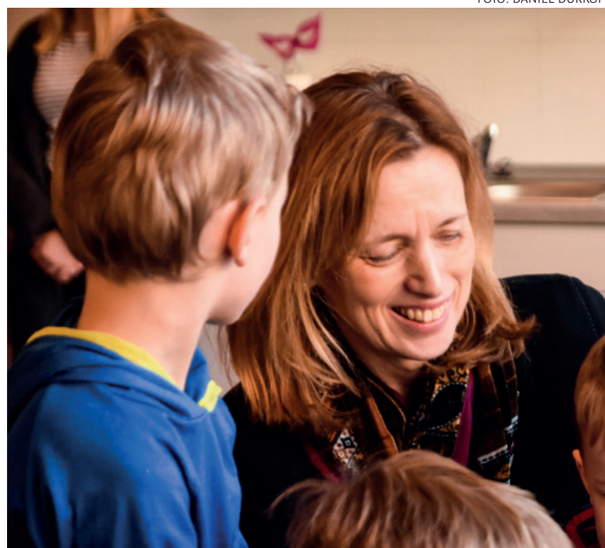
Undervisningsminister Karin Prien sammen med førskolebørnene.