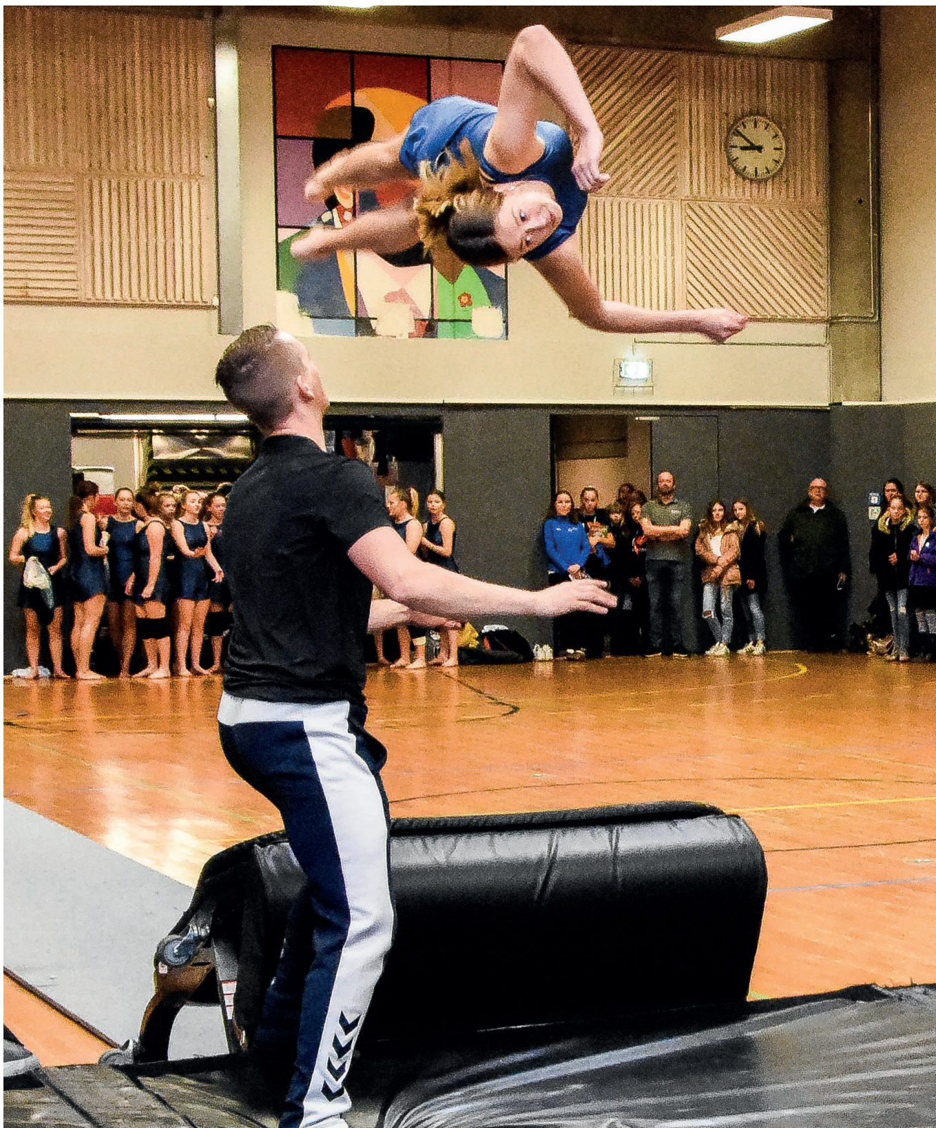
Vojens gymnastik- og idrætsefterskole var kommet med et springhold til Sydslesvig.