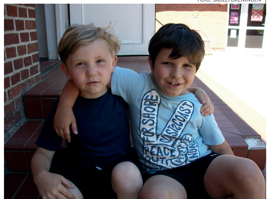
...og gik arm i arm.

gen. Og det udløser måske spørgsmålet om, hvorfor der er danske syd for grænsen.