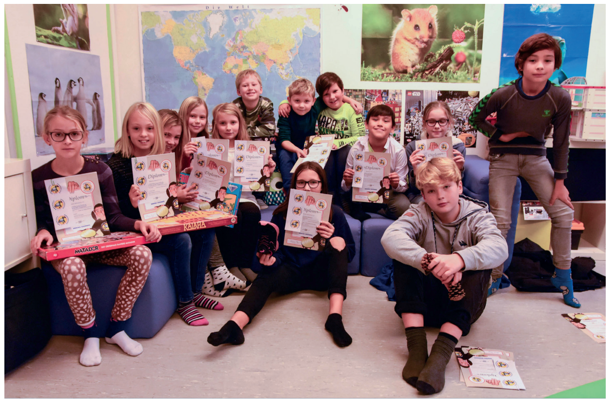
SFOen i Skovlund har mere end ti rekorder i børnenes rekordbog.

For tiden tager cirka 100 elever fra Sydslesvig hvert år på efterskole.