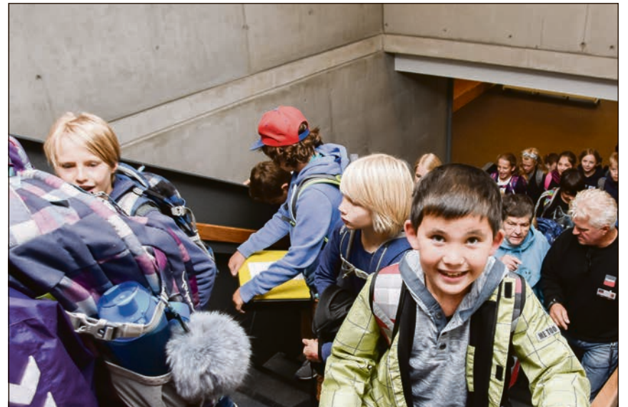
...og eleverne fyldte bygningen med liv.