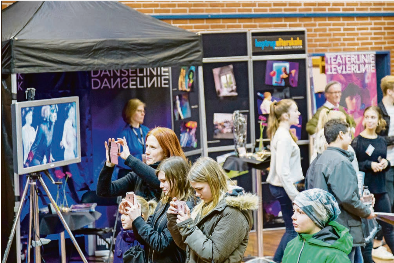
Efterskolernes dag i Idrætshallen i Flensborg i år.