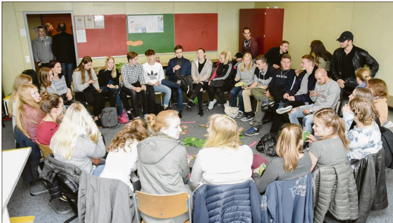
Debatløst hos De Grønne.

- Med den socialpolitik socialdemokraterne føre lige for tiden, kan jeg ikke se basis for et regeringssam-