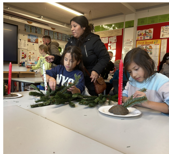
Kalenderlyset må gerne være midtpunkt i en fin dekoration, og sådan en kan man hvert år lave til julefesten i Sørup.

Se og læs her om de forskellige juleaktiviteter og se, om det gør noget ved julestemningen. Eller den er der måske allerede?