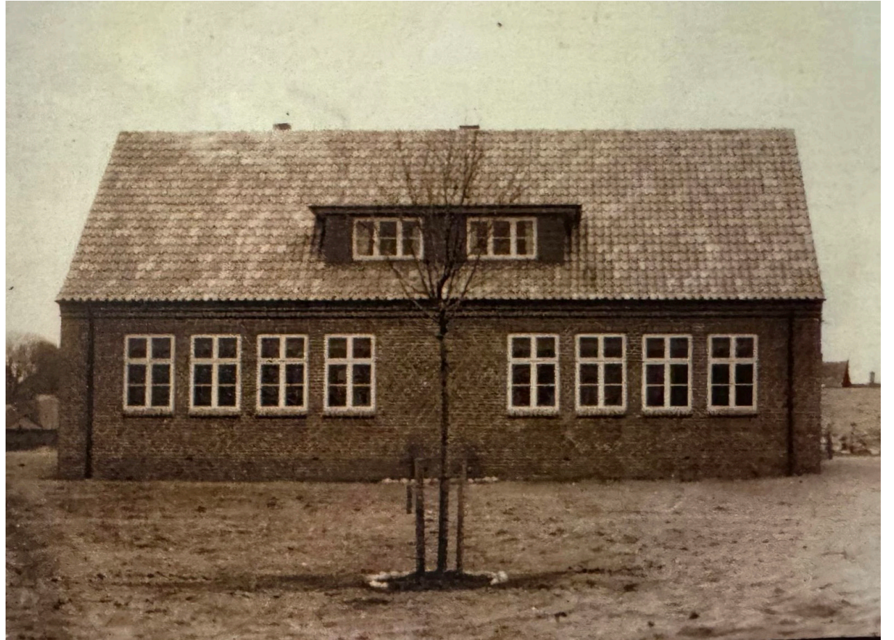
Sådan så den nybyggede skole ud, da den åbnede dørene for danske elever i Egernførde og omegn.

Mette Tode blev bedt om at sige noget, man kunne forestille sig, en skoleinspektør ville kunne have sagt for 75 år siden, og hendes reprimande om eftersidning og straf-skrivning i kladdehæftet var så overbevisende, at de (måske lidt overraskede) elever kvitterede med