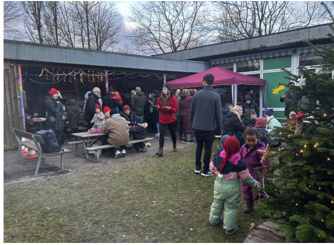
Vesteralle Børnehave har holdt sit første julemarked – med værksteder, æbleskiver og dans om juletræet.