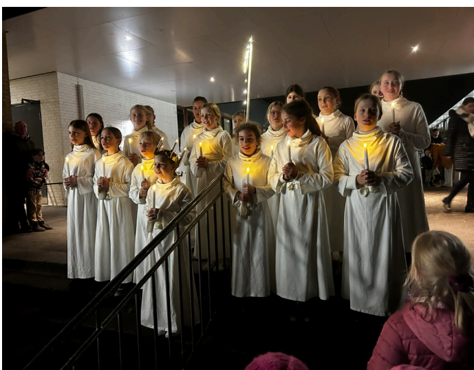
Et smukt og stemningsfyldt luciaoptog i Jørgensby-Skolens skolegård rundede julefesten af.

- Aldrig før har så mange mennesker været med til at fejre jul på Jøby.