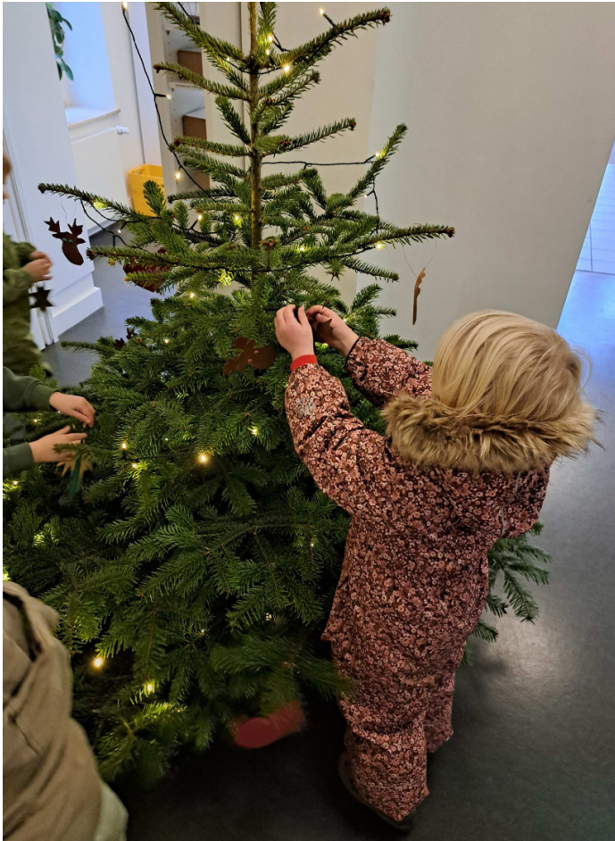
Ællingerne fra Oksevejen har pyntet træerne i Skoleforeningens centralforvaltning.

Mange tak, søde nisser/ællinger – I må meget gerne komme igen en anden gang.