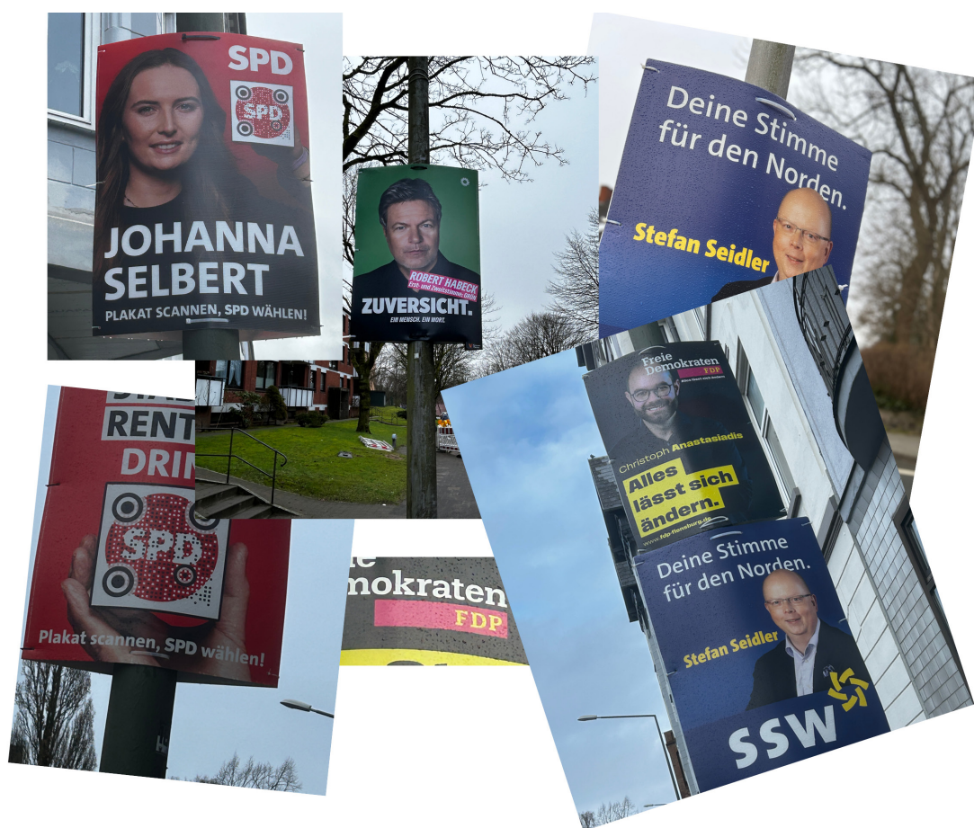
De hænger side om side i lygtepælene, og den 7. februar sidder kandidaterne også side om side, når der er politisk debat på Duborg-Skolen.