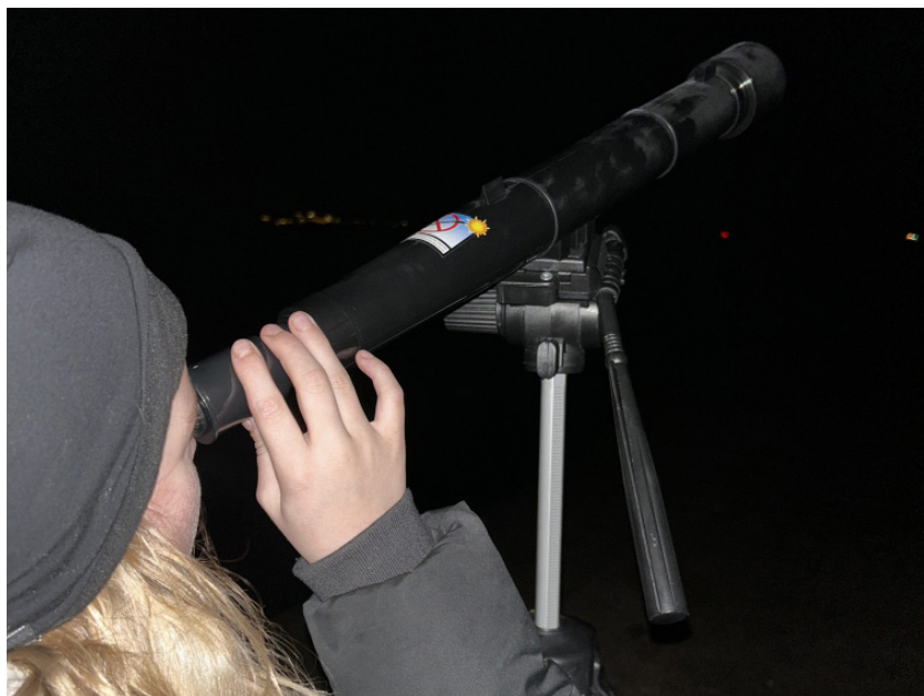
Der var stor interesse for at finde planeter og kigge stjernebilleder, som eleverne har lært om i undervisningen.