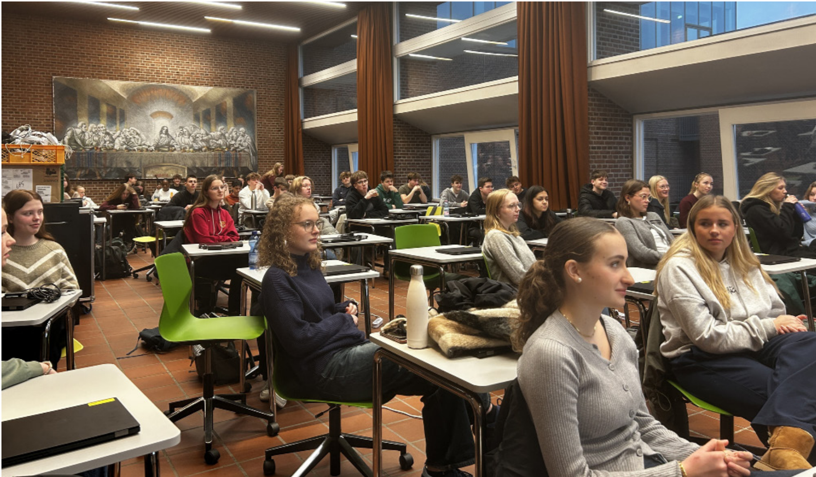
Inden Duborg-Skolen den 7. februar får besøg af et panel politikere, var der den 27. januar afsat en hel dag til, at 10. årgang kunne blive lidt klogere på politik, partier og valg.