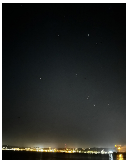
Nattelys: Både over Flensburg og oppe på himlen.

Alle var blevet bedt om at tage lidt mad med til en fælles buffet, og Charlotte Grau og Rasmus Raun havde booket ti galileoskoper