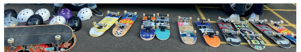
Eleverne lærte hurtigt at køre på ramperne.

nyngste elever var snart de mest modige, mener han.