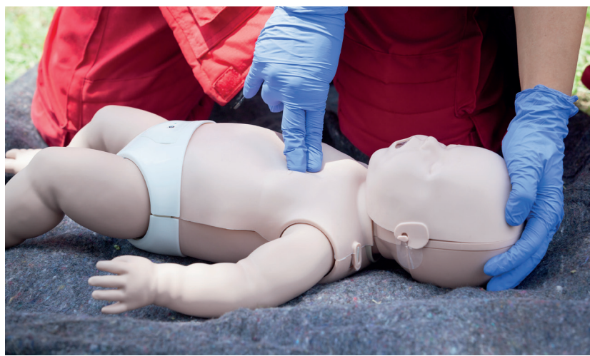
Hjerte-lunge-redning hos spædebørn.

Kursisterne lærte også, hvordan man laver hjerte-lunge-redning hos