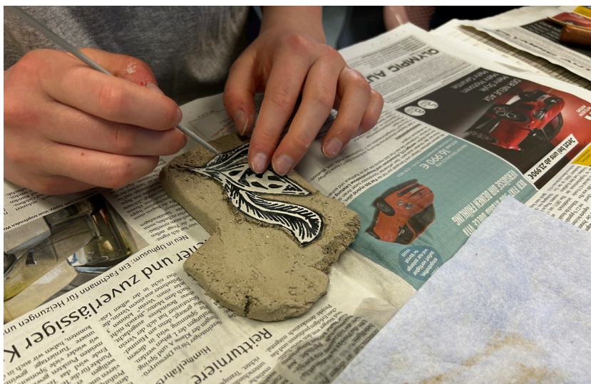
Ikke så snart havde eleverne fået en kort instruktion, før de kastede sig over fremstillingen af relieffer til fredsenglen.