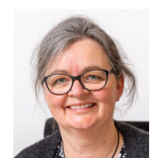
Redaktion: Trine Flamming, kommunikations- medarbejder hos Skoleforeningen