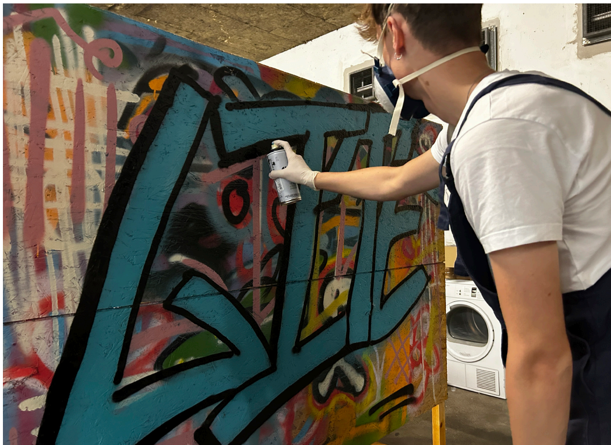
Der var flere i graffiti-workshoppen, der havde håndteret en spraydåse før.

I strikkebutikken Lindbøg på gaden kunne begyndere og øvede komme og strikke, i Flensborghus havde et dusin elever meldt sig til blandt andet at debattere under overskriften »Sydslesvig dør. Er det din skyld?«, og på skolen kunne man stifte bekendtskab med keramik, tegne, skate og få svar på, om