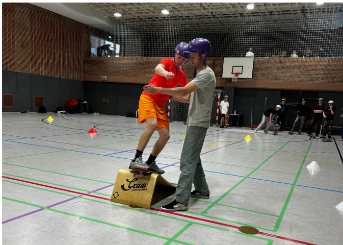
Balance og afpasset fart, og så når man op på rampen og kan køre ned ad den igen. Skulle der være brug for hjælp, stod Hinnerk Petersen klar med råd og dåd.