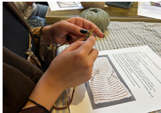
Det ser så let ud, når andre gør det. Men det der med at strikke skal man altså lige lære først. Men det kan lade sig gøre - for nogle endda hurtigt.