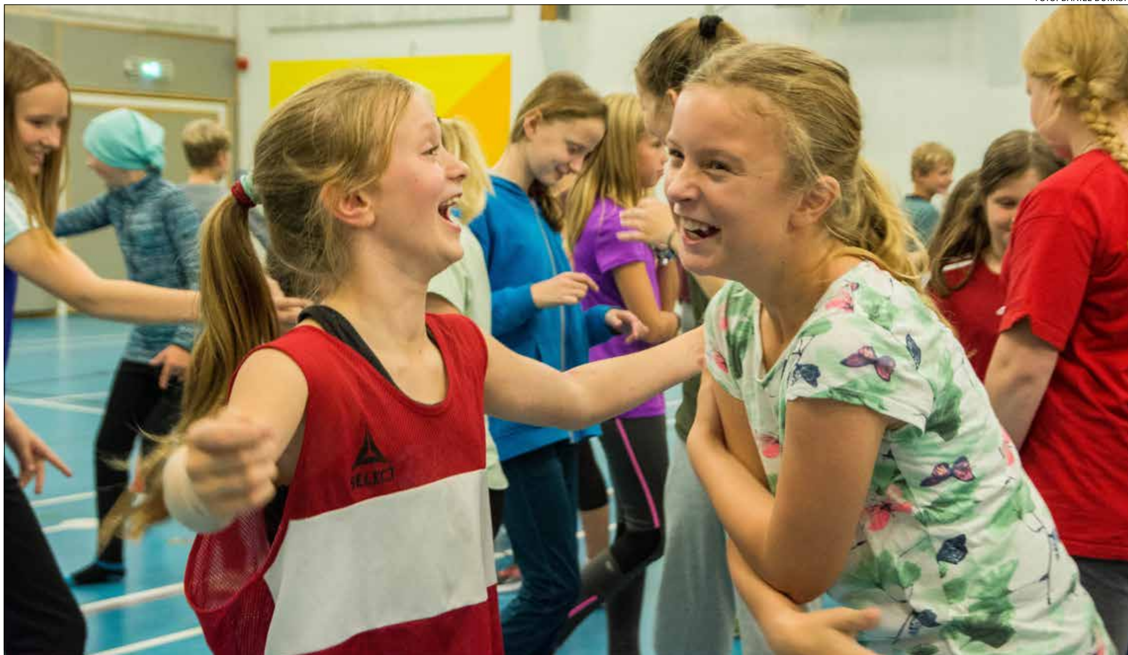
160 elever fra de danske skoler i Sydslesvig blev forleden uddannet i at være legepatruljer på skolegårde.