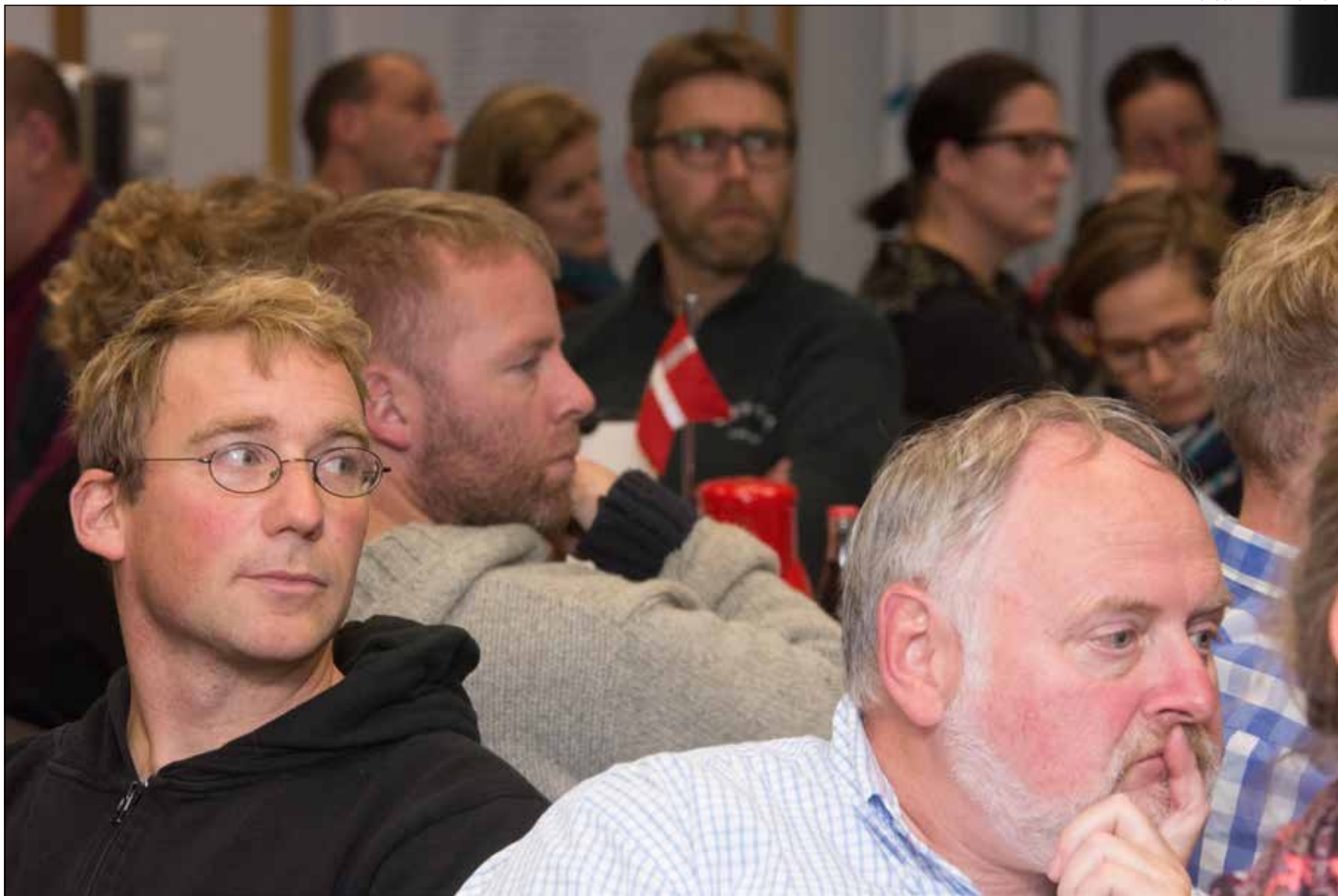
Skoleforeningens nyvalgte fællesråd mødtes for første gang i Husum i sidste uge.