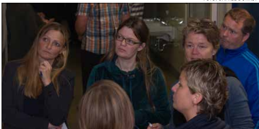
Forældrerepræsentanter diskuterer den gode skole.

For også at fastholde bevidstheden om den dannelsesmæssige ramme, som Skoleforeningen arbejder i, med og ud fra, er der blevet udarbejdet en fælles indledning til alle fagene, der, udover at redegøre for de nye læreplaners opbygning og terminologi, fastholder, hvad vi vil med det at