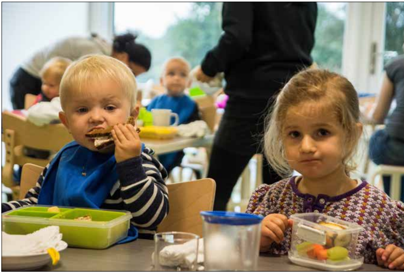
Harreslevløkke Daginstitution åbnede efter sommerferien.