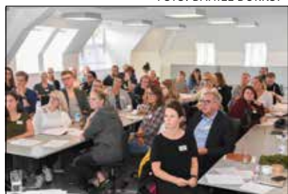
Kursus for de nye.

Her fik »de nye« blandt andet et indblik i Skoleforeningens indsatsområder, kursusvirksomhed, fritidsordninger og fælles evaluering.