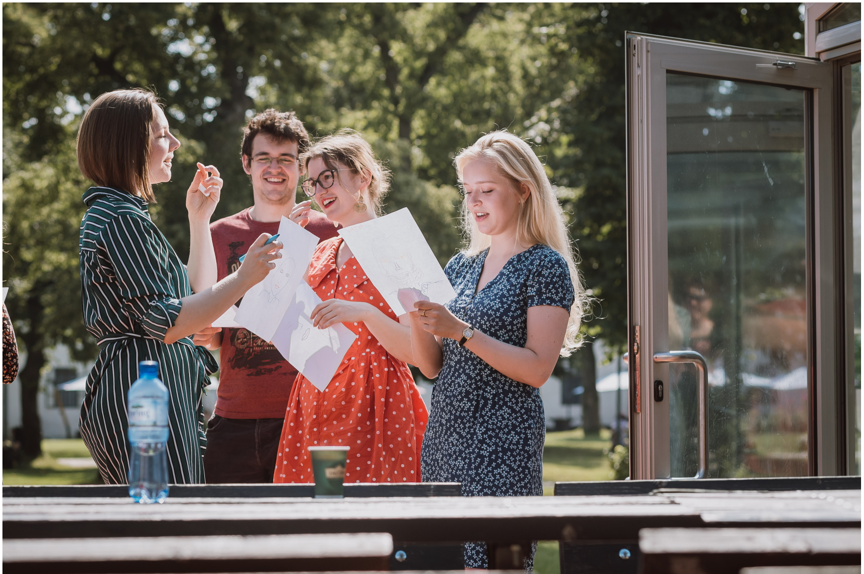
Europæiske unge, der er optaget af mindretalsspørgsmål, mødes på Jaruplund Højskole i 2020.

De unge europæere får mulighed for at få kendskab til den danske højskoletradition og samtidig opnå de eftertragtede ECTS-points, fordi programmet kombinerer meritgodkendte universitetsstudier med almen højskole. På hjemmesiden www.minoritychangemaker.eu kan man læse beskrivelser af alle fag og faglige forløb, ligesom gæster, foredragsholdere og udflugter bliver præ-