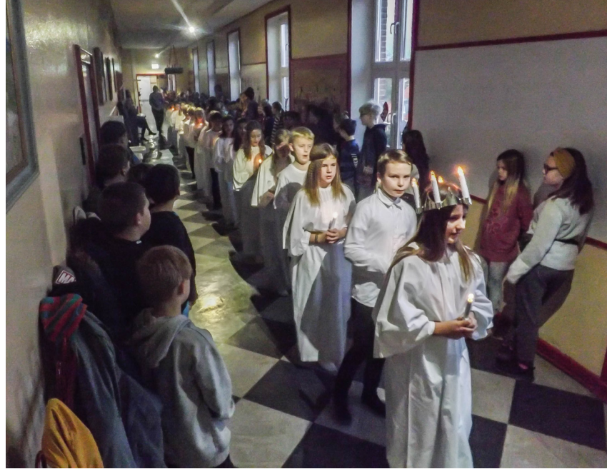
Lucia-piger og drenge på Cottorp-Skolen i Slesvig.