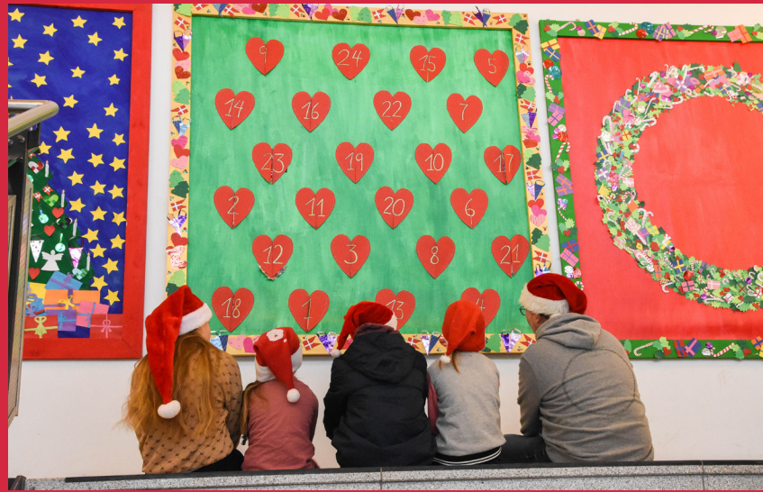
Årets julebillede på Sønder Brarup Danske Skole.