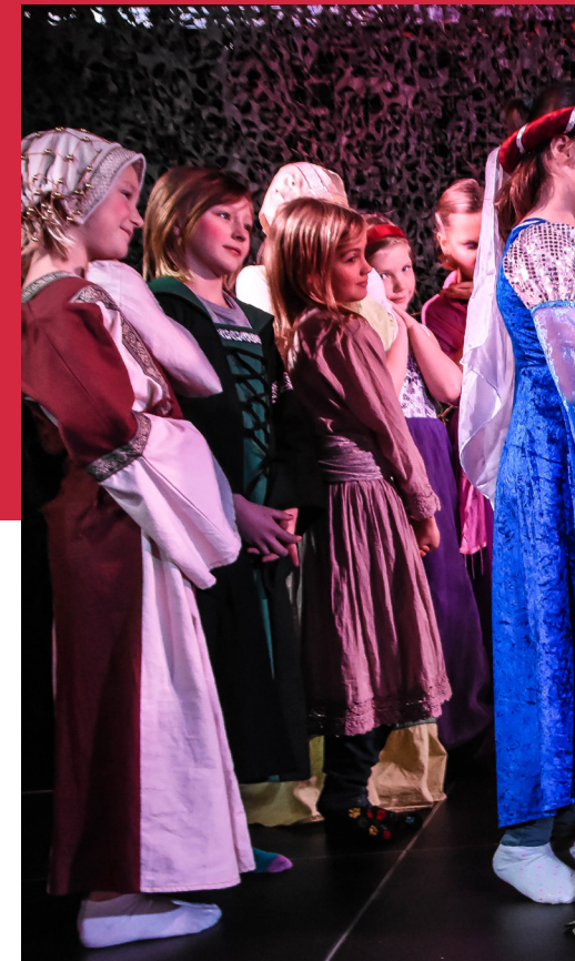
Juleteater på Risse Schölj.