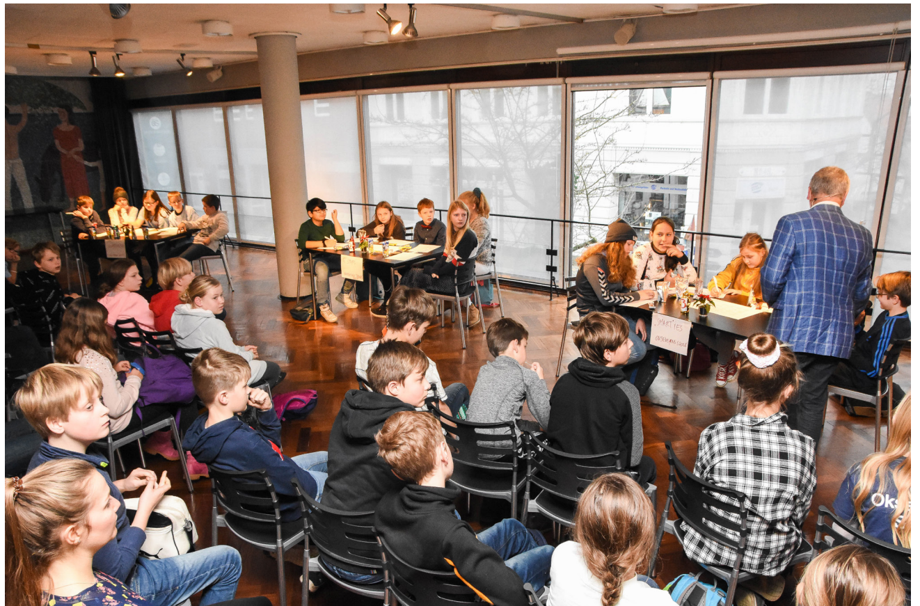
Konkurrencen i Sydslesvig fandt sted på biblioteket i Flensborg.