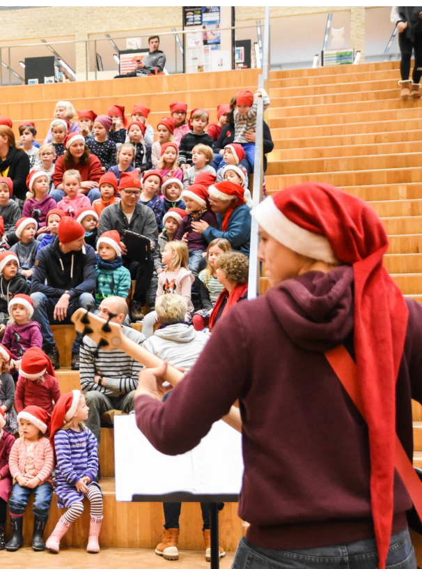
A. P. Møller Skolen i Slesvig.