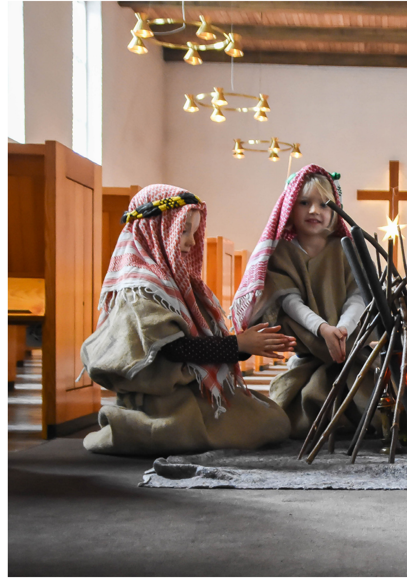
Kobbermølle Børnehave på julevandring i Ansgar kirken i Flensborg.