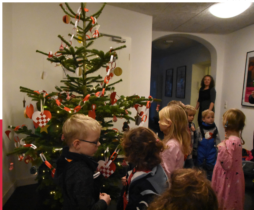
Jørgensby Børnehave pyntede juletræet i centralforvaltningen