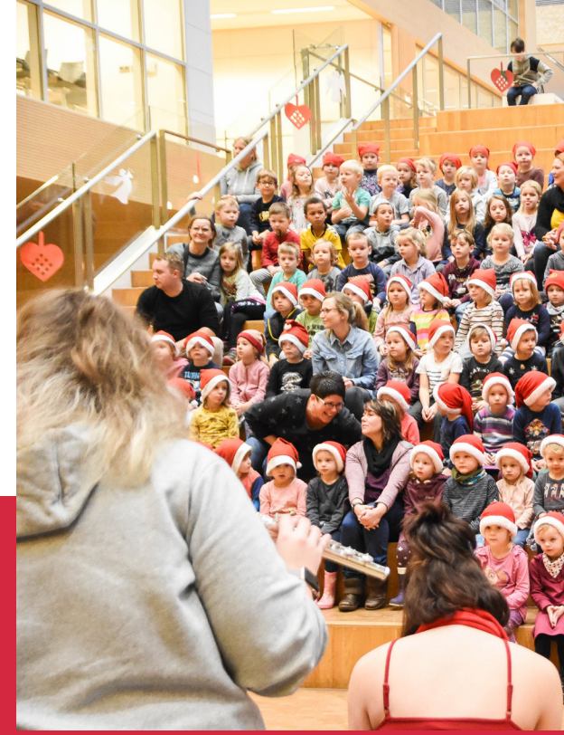
Børnehaverne i Slesvig og omegnen dansede om juletræet på