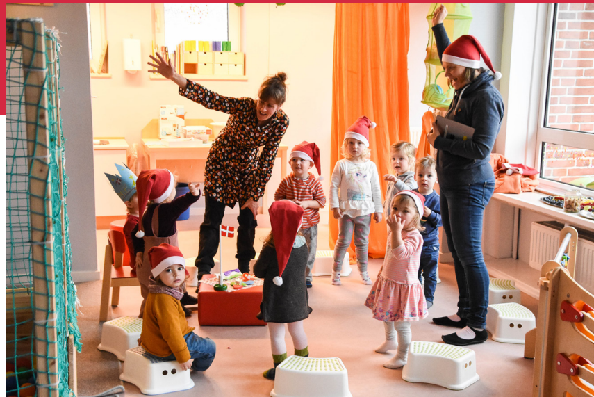
Glade julenisser i Sønder Brarup Børnehave