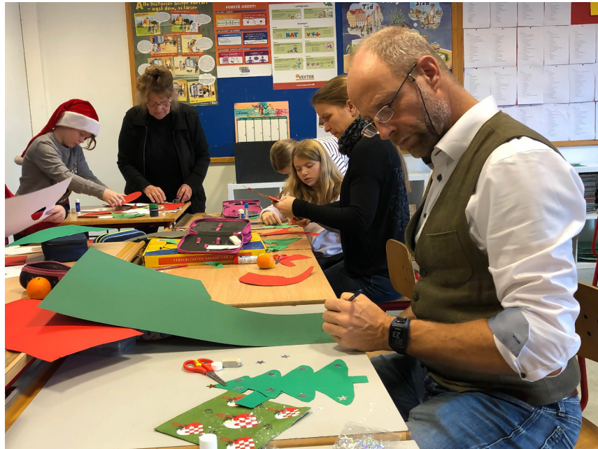
Juleklip på Cornelius Hansen-Skolen i Flensborg.