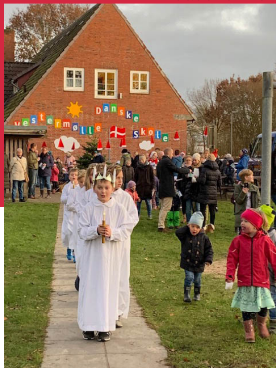
Luciaoptog i Vestermølle.