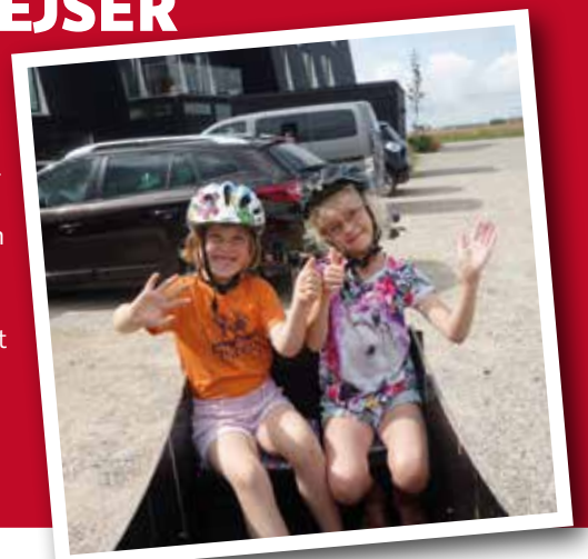
FOTO: FAMILIEN KIRKALDY NIELSEN (TIL VENSTRE SES VÆRTSØSTER FRA DANMARK OG TIL HØJRE FERIEBARN FRA SYDSLESVIG)

I 1919 rejste ferie børn fra Sydslesvig til Danmark for allerførste gang. Siden da har tusindvis af mennesker knyttet bånd og fået familiære forbindelser hen over grænsen. Sydslesvigske Børns Ferierejser er en unik tradition, og man kan ikke forestille sig det danske mindretal uden. Ferierejserne har en uvurderlig betydning som livsnerve til Danmark, og selvom antallet af ferie børn ikke længere er helt så højt som for hundrede år siden, er efterspørgslen på feriepladser fortsat stor. Vi håber derfor på, at 100 ferieværter vil melde sig til sommersæsonen 2019. Så hjælp os med at gøre 100-året til noget helt særligt. Spred ordet, skab minder for livet!