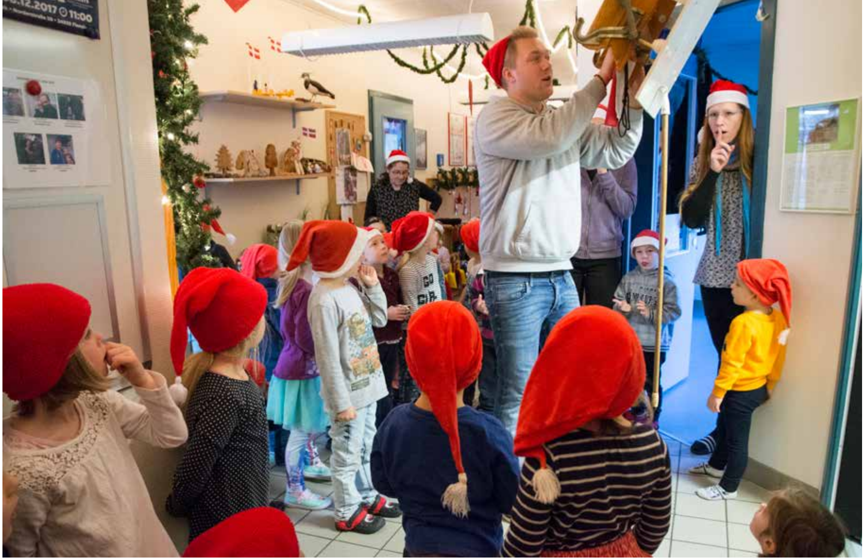
Ssh, stille! Nissen sover, og det går ikke, at nissebørnene i Tarp Børnehave vækker ham, når de hver morgen henter gårdsdagens tomme skål ned fra hans loft og bærer en ny med lækkerier op til ham. Enten småkager eller risengrød.

Georg fortæller, at byen Tarp har fået penge af "Deutsche Kinder- und