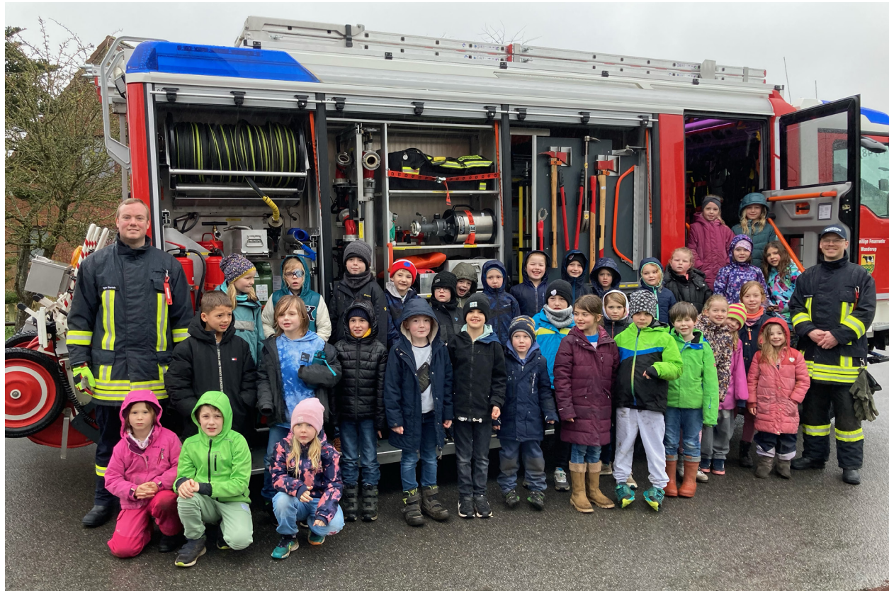
Mod er en af de 24 topstyrker, man taler om inden for positiv psykologi. Som et helt konkret eksempel på et modigt job, troppede det lokale frivillige brandværn op på skolen i Vanderup.