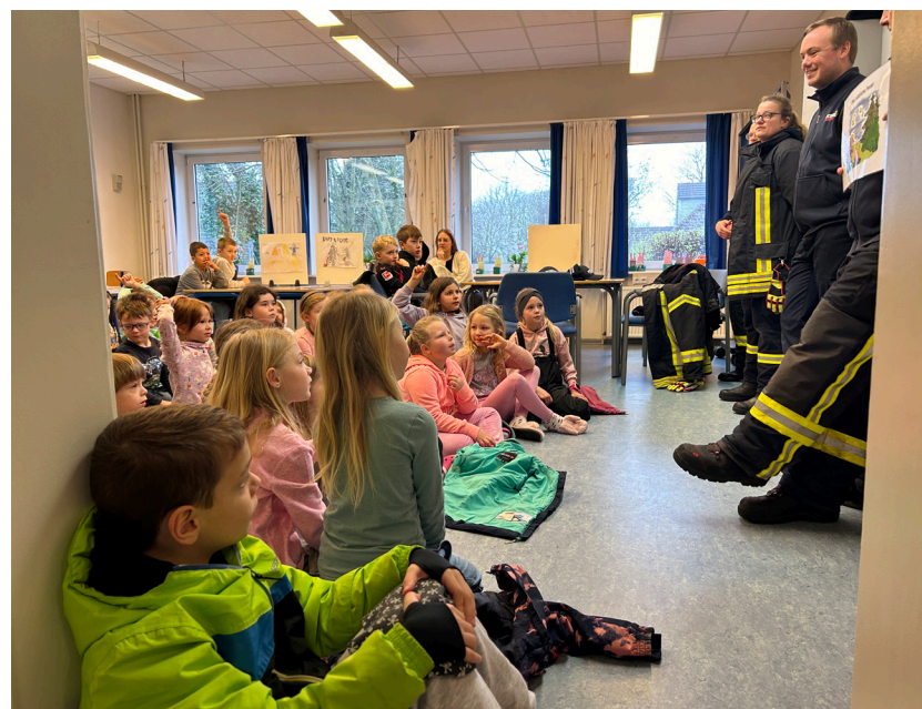
Eleverne og førskolebørnene var lydhøre, da de fire frivillige brandfolk fortalte om deres arbejde.

Als Teil der Bemühungen, das Wohlbefinden zu verbessern, haben die Einschulungskinder der Store Vi-Vanderup Danske Skole ein Projekt durchlaufen, das sich um Mut drehte.