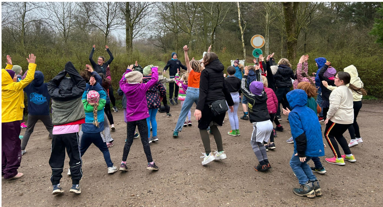
Det var kun datoen, der afslørede, at motionsløbet fandt sted i marts og ikke dagen før efterårsferien, så opvarmningen var nok en god ide.

Hver runde var en kilometer lang, og måske skulle motivationen hos de løbeflittige elever findes i, at