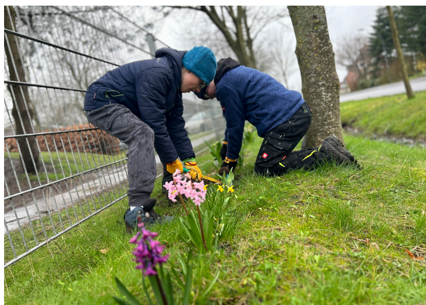
Regnede siledede ned, men det afholdt ikke eleverne på Risum Skole/Risem Schöjl fra igen i år at plante blomster på og ved skolen.

Dagen sluttede på grund af regnen ikke som planlagt med bål, men med leg, spil og boller af sno-brødsdejen.