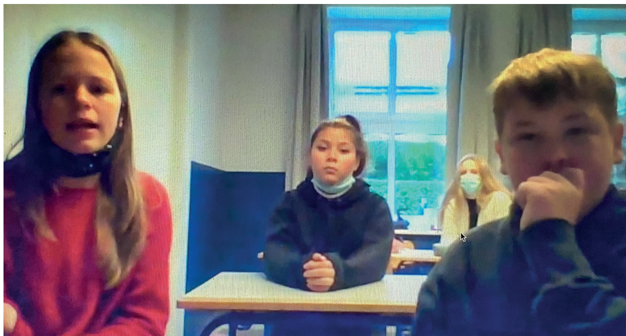
Syv elever fra Vyk Danske Skole har skrevet en bog.