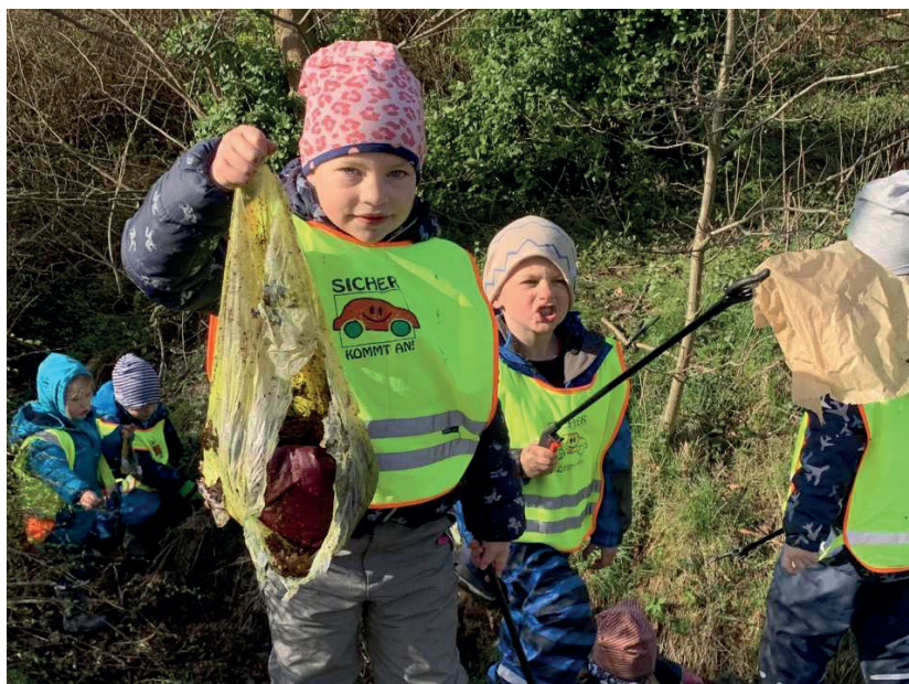
Flittige børnehavebørn i alle aldre var med til at samle godt 40 kg affald i og omkring Garding.