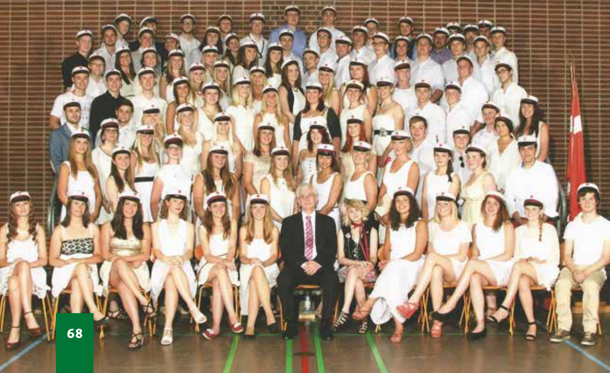
Duborg-Skolens studenter 2014.

I efteråret 2013 blev der afholdt en række møder i styregruppen, hvor projektforslaget blev rettet til – både i forhold til skolens ønsker og den økonomiske ramme. Dette mundede ud i et