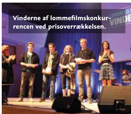
Vinderne af lommefilmskonkurrencen ved prisoverrækkelsen.

300 gymnasielever fra Sydslesvig deltager i projektet »Future Borders - Young Minds in Digital Action«. Elever fra A. P. Møller Skolen vinder i lommefilmskonkurrencen med et bidrag om »Demokrati - 1864 til fremtiden«.