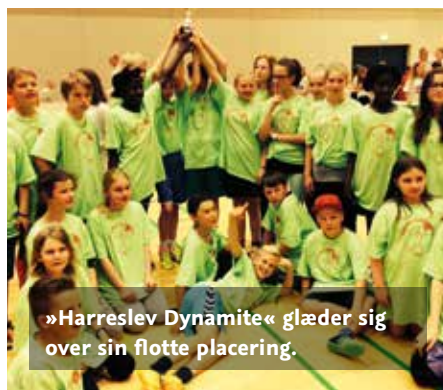
»Harreslev Dynamite« glæder sig over sin flotte placering.

rer Sydslesvig ved finalstævnet for Danmarksmesterskaberne i håndbold og vinder en flot 3. plads.