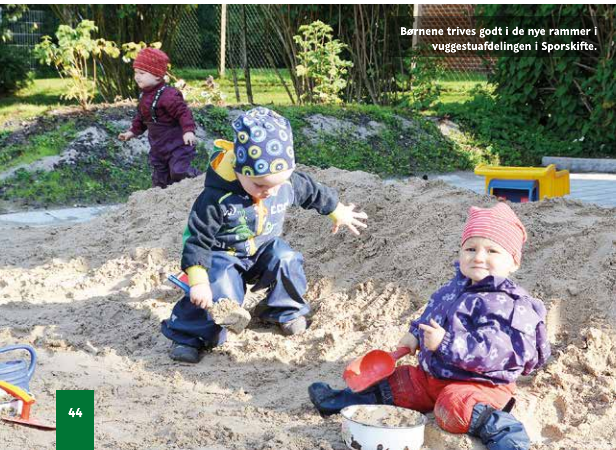
Børnene trives godt i de nye rammer i vuggestuaufdelingen i Sporskifte.

Etableringen af nye pladser til børn under tre år har ikke kun været meget i fokus syd for grænsen. Udbygningen har også haft stor bevågenhed i Danmark, og Skoleforeningens indsats på området har været omtalt i blandt andet Kristeligt Dagblad og Danmarks Radio.