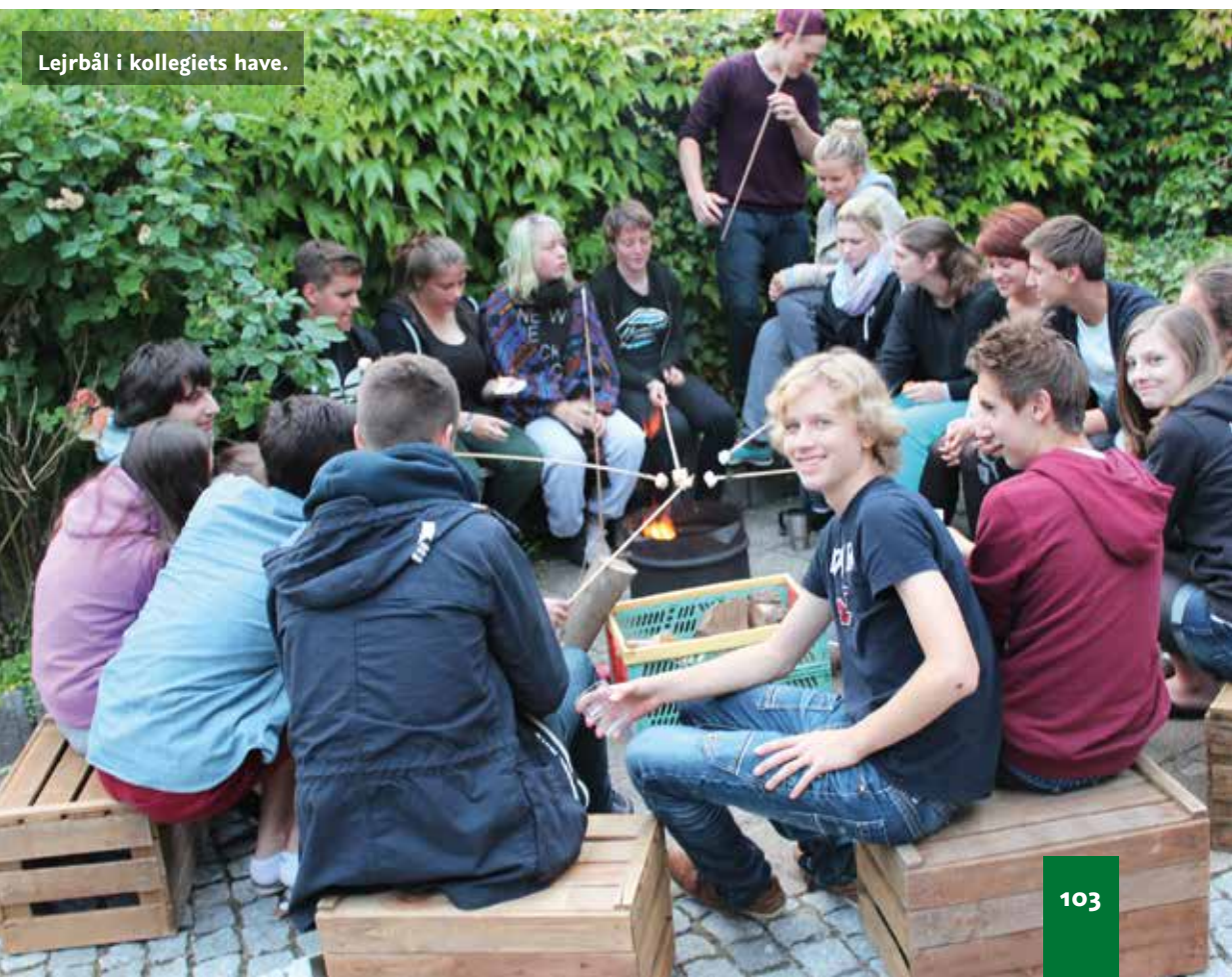
Lejrbål i kollegiets have.

I det store køkken har vi fået enkelte nye opgaver. Udover kollegiets beboere spiser elever fra Gustav Johannsen-Skolens heldagskole med til middag, indtil deres skole er udbygget med eget spiseområde. Ordningen fungerer uproblematisk; børnene får et sundt måltid, og enkelte af dem snupper sig da også lige et spil airhockey, nu de alligevel er på besøg her.