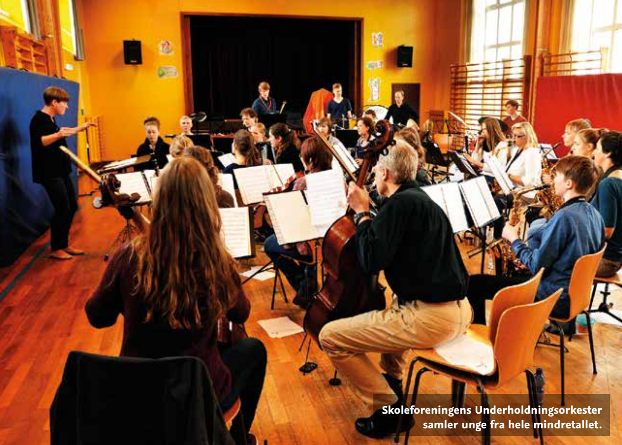
Skoleforeningens Underholdningsorkester samler unge fra hele mindretallet.

Endvidere optrædes der også i sammenhænge uden for skolen, for eksempel i kirken (høst- eller julegudstjeneste), til årsmøder og på alderdomshjem.