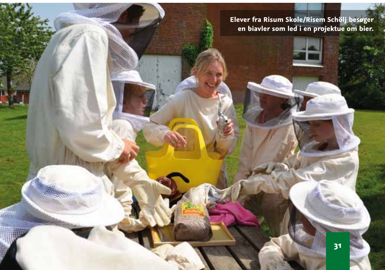
Elever fra Risum Skole/Risem Schölj besøger en biavler som led i en projektue om bier.

I forbindelse med opslaget af stillingen som forstander for Jaruplund Højskole opstod der en kompetencestrid mellem Jaruplund Højskoles bestyrelse og Skoleforeningens styrelse. Uenigheden drejede sig blandt andet om ansættelsesvilkår, og om tidspunktet for et stillingsopslag skulle ligge før eller efter,