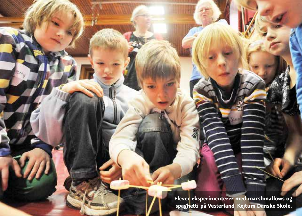
Elever eksperimenterer med marshmallows og spaghetti på Vesterland-Kejtum Danske Skole.

undervisningstiden. Vi bliver derfor også nødt til at overveje, hvordan vi kan befordre en yderligere udvikling af heldags-skolen.