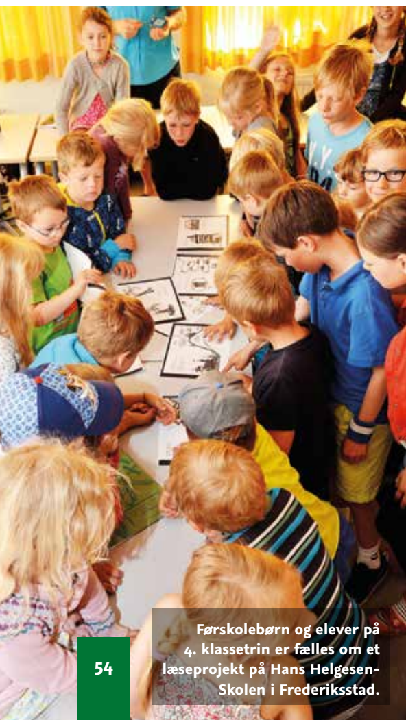
Førskolebørn og elever på 4. klassetrin er fælles om et læseprojekt på Hans Helgesen-Skolen i Frederiksstad.

Læsning er igen kommet massivt på dagsordenen i disse år, da flere internationale undersøgelser, som for eksempel PISA og PIRLS, påpeger, at alt for mange elever forlader skolen uden funktionelle læsekompetencer. Skoleforeningens officielle læseprøver, gruppelæseprøverne, har ligeledes gennem de sidste år vist, at vores elevers læsestandpunkter i 2.-5. klasse trænger til et løft. Udvalget Sprog og Læsning har derfor dannet en arbejdsgruppe, som beskæftiger sig med at tilrettelægge indsatsen for at styrke læsningen på skoleområdet. Skoleforeningen havde i løbet af skoleåret 2013-2014 undersøgt, i hvilke danske kommuner man har haft gode erfaringer med at løfte læsningen med en særlig indsats. Med afsæt i Haderslev Kommunes positive erfaringer med metoden »Læseskub« i indskolingen er udvalget gået i gang med at planlægge en Læseskub-uddannelse for lærere samt udarbejde et koncept for, hvordan læsningen på skolerne kan styrkes yderligere – ikke kun i indskolingen, men i hele skoleforløbet. Arbejdet har resulteret i et læsekoncept for Skoleforeningen i skoleåret