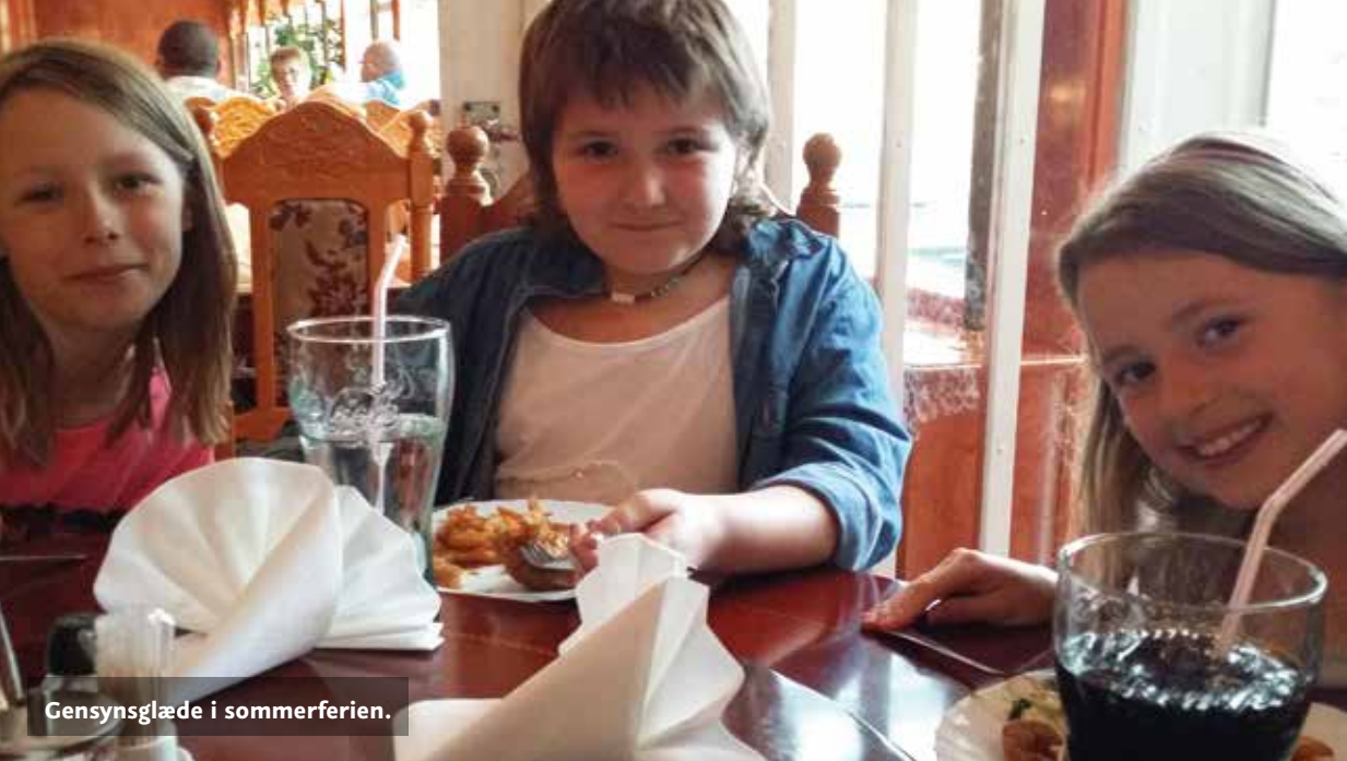
Gensynsglæde i sommerferien.