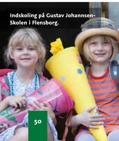
Indskoling på Gustav Johannsen-Skolen i Flensborg.

Elevtallet pr. 1. september 2014 er faldet lidt i forhold til elevtallet pr. 1. september 2013. Det gennemsnitlige elevtal for 2013 blev opgjort til 5.663, hvilket er 27 elever mindre end antaget, da vi lavede vores prognose for et år siden. For kalenderåret 2014 siger vores prognose, at det gennemsnitlige elevtal vil ligge omkring 5.680, mens prognosen for kalenderåret 2015 siger, at det gennemsnitlige elevtal vil være ca. 5.760. Antallet af nye elever i kommende 1. klasse i skoleåret 2015-2016 vil være nogenlunde det samme som i 2014. Som det ser ud lige nu, vil det gennemsnitlige elevtal stige lidt. Alt i alt vurderes, at elevtallet er stabilt til let stigende.