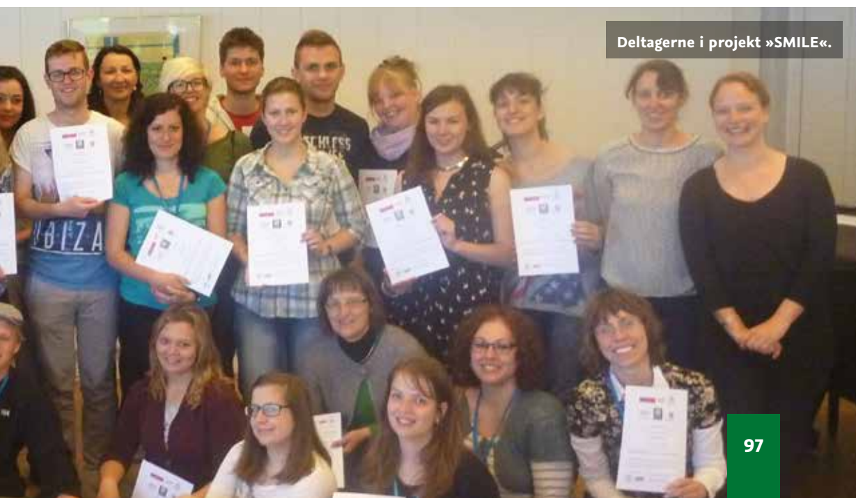
Deltagerne i projekt »SMILE«.

Foruden UC Syddanmark involverede projektet professionshøjskoler fra Irland, Rusland, Rumænien, Finland og Ungarn. Projektet var et samarbejde med Deutscher Schul- und Sprachverein (DSSV), Dansk Skoleforening for Sydslesvig samt tilknyttede partnere fra ECMI (European Center for Minority Issues) og den tyske afdeling af EDCR (Ethnocultural Diversity Resource Center; Rumænien).