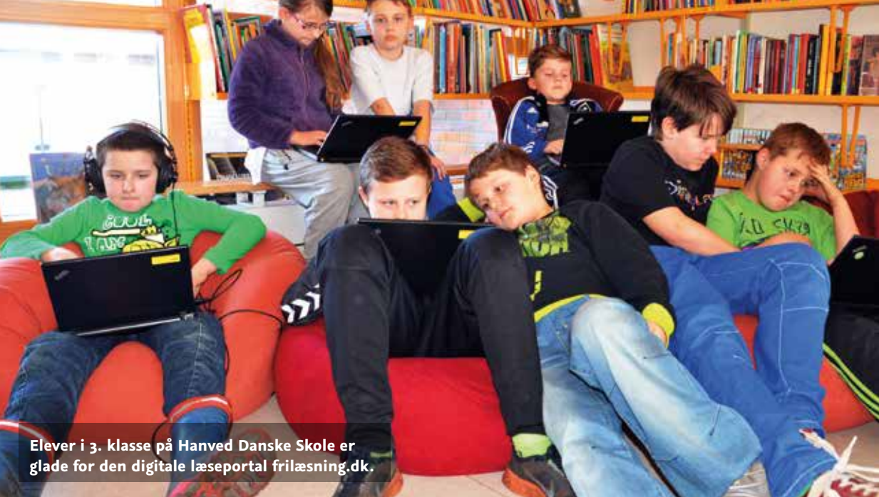
Elever i 3. klasse på Hanved Danske Skole er glade for den digitale læseportal frilæsning.dk .

2014-2015, som er blevet præsenteret på to skoleledermøder i foråret og sommeren 2014. En del af dette koncept er, at alle skolerne fra og med næste skoleår har mindst én læsekoordinator, som skal være tovholder og nøgleperson i forbindelse med skolens læseindsats. Alle skoler med indskoling har tilmeldt en lærer til Læseskubuddannelsen, der er startet i september 2014.