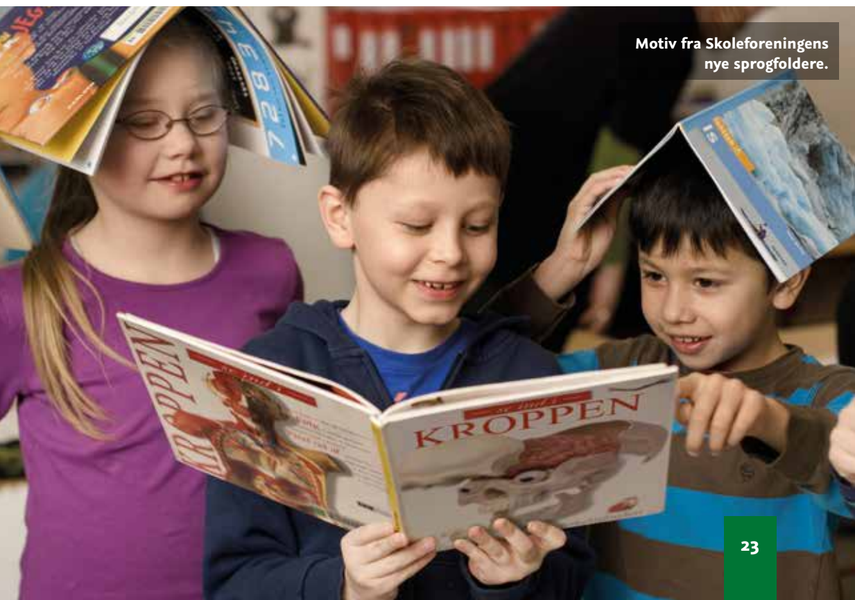
Motiv fra Skoleforeningens nye sprogfoldere.

tilfredsstillende. Det er derfor glædeligt, at der er sat en række initiativer i gang, der skal være med til at vende udviklingen. Således er der ved dette skoleårs begyndelse blevet udpeget læsekoordinatore, der skal styrke læseindsatsen på den enkelte skole. Ligeledes er der afsat ekstra midler til at give udvalgte elever et ekstra læseskub på 1. og 2. klassetrin. PPR vil forstærke sin vejledende indsats over for de skoler, hvor læsestandpunkterne viser, at der er behov. Nye foldere vil gøre forældrene opmærksomme på deres rolle med henblik på at understøtte