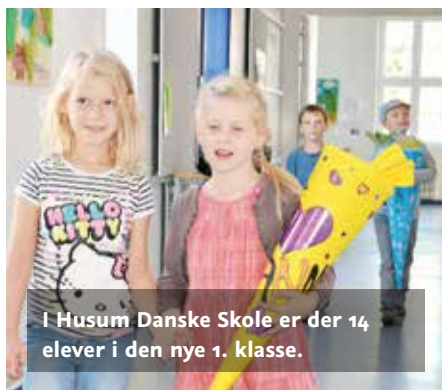
I Husum Danske Skole er der 14 elever i den nye 1. klasse.

533 børn bliver indskolet på de danske skoler i Sydslesvig. Mens indskolingens på øerne foregår 18.-19. august, ligger indskolingsdagen på fastlandet enten den 25. eller 26. august.