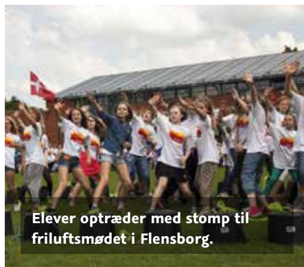
Elever optræder med stomp til friluftsmødet i Flensborg.

Elever fra de danske skoler i Store Vi, Tarp, Jaruplund og Vanderup deltager i optoget og præsenterer en stomp-opvisning på årsmødepladsen ved de danske årsmøder i Flensborg.