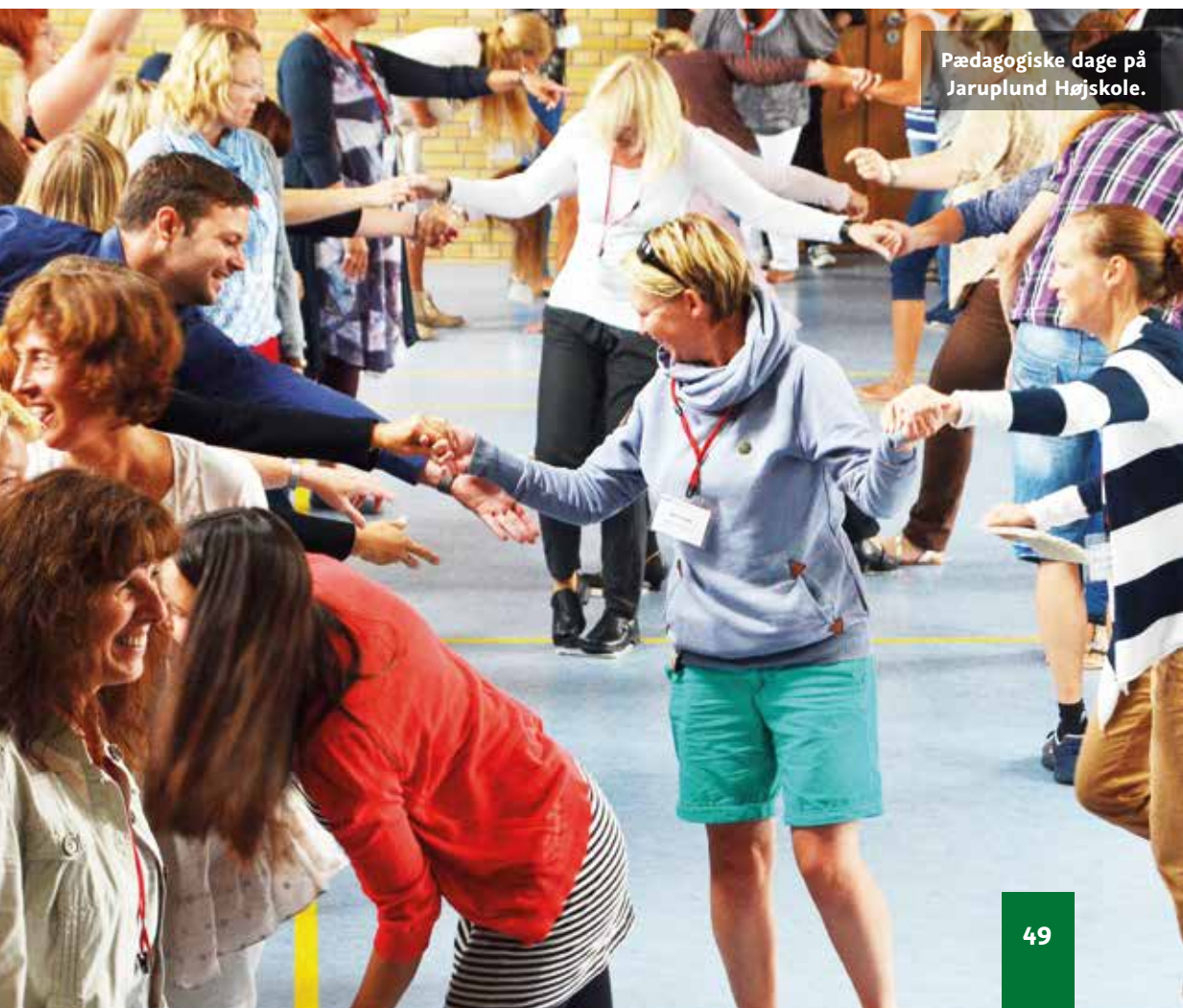
Pædagogiske dage på Jaruplund Højskole.

til at lytte til deres egen kommunikation og se på deres egne handlinger. Dermed blev forudsætningerne skabt for et konstruktivt udbytte af hinandens forskellighed. I mindre grupper og på baggrund af ny viden om metoder kunne deltagerne afprøve sig selv i forskellige samarbejdsøvelser. De »Pædagogiske Dage 2014« blev til to meget dynamiske, sjove og (arbejds) glade dage.