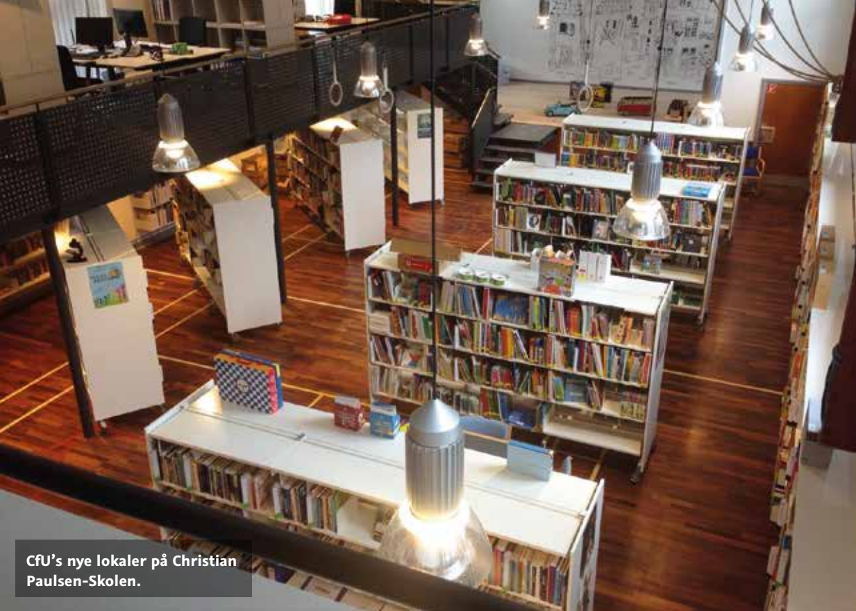
CfU's nye lokaler på Christian Paulsen-Skolen.

system, så CfU's brugere med nogle ganske få klik kan se, hvilke undervisningsmaterialer der løbende bliver anskaffet til de enkelte fag.