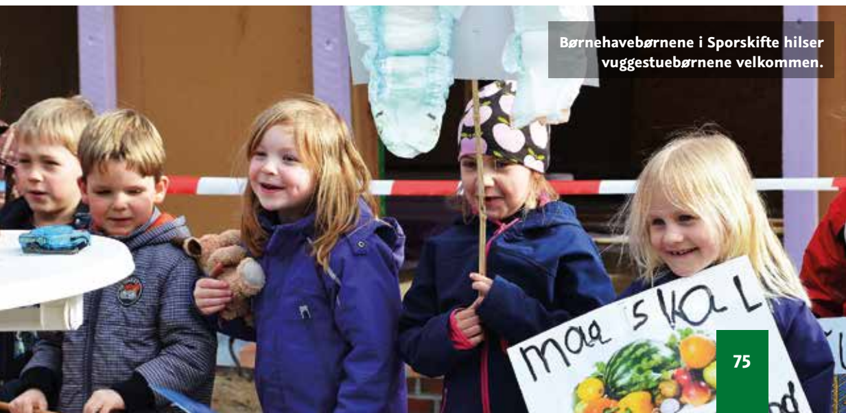
Børnehavebørnene i Sporskifte hilser vuggestuebørnene velkommen.

Harreslev Danske Skole (udvidelse), Hanved Danske Skole (udvidelse af biblioteket), Jernved Danske Skole (boldspilhal), Jes Kruse-Skolen i Egernførde (tilbygning og idrætshal), Jørgensby-Skolen i Flensborg (idrætshal), Medelby Danske Skole (tilbygning og nybygning af børnehave), Nibøl Danske Skole (ombygning), Oksevejens Skole i Flensborg (tilbygning), Satrup Danske Skole (udvidelse og etablering af børnehave), Store Vi Danske Skole (udvidelse).