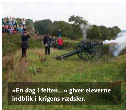
»En dag i felten...« giver eleverne indblik i krigens rædsler.

Næsten 700 elever fra 5. og 6. klasser i hele Sydslesvig er med til arrangementet »En dag i felten...« ved Dannevirke. Arrangementet er del af Skoleforeningens projekt »Rundt om 1864« i anledning af 150-året for tilbagetrækningen fra Dannevirke og slaget ved Dybbøl. Projektet støttes af 30 pensionerede lærere og pædagoger.