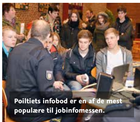
Poilitiets infobod er en af de mest populære til jobinfomessen.

Jobinformationsmessen på Duborg-Skolen, som hvert år arrangeres af Duborg-Skolen, Gustav Johannsen-Skolen og Cornelius Hansen-Skolen, byder på omfattende informationer om job- og uddannelsesmuligheder.