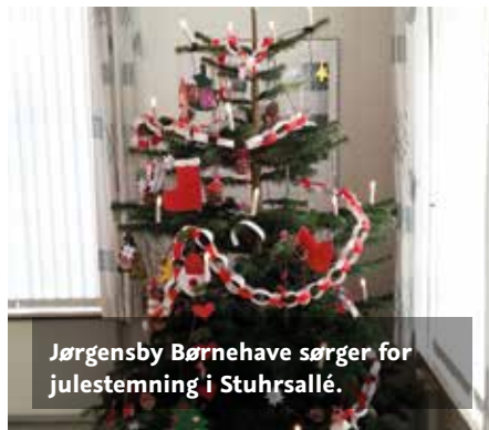
Jørgensby Børnehave sørger for julestemning i Stuhrsallé.

har været flittige og fremstillet den fineste juletræsdynt. Med hjerter, stjerner, nisser og en lang guirlande stråler juletræet i dejlig glans og spreder julehygge i forvaltningens opholdsstue i Stuhrsallé.