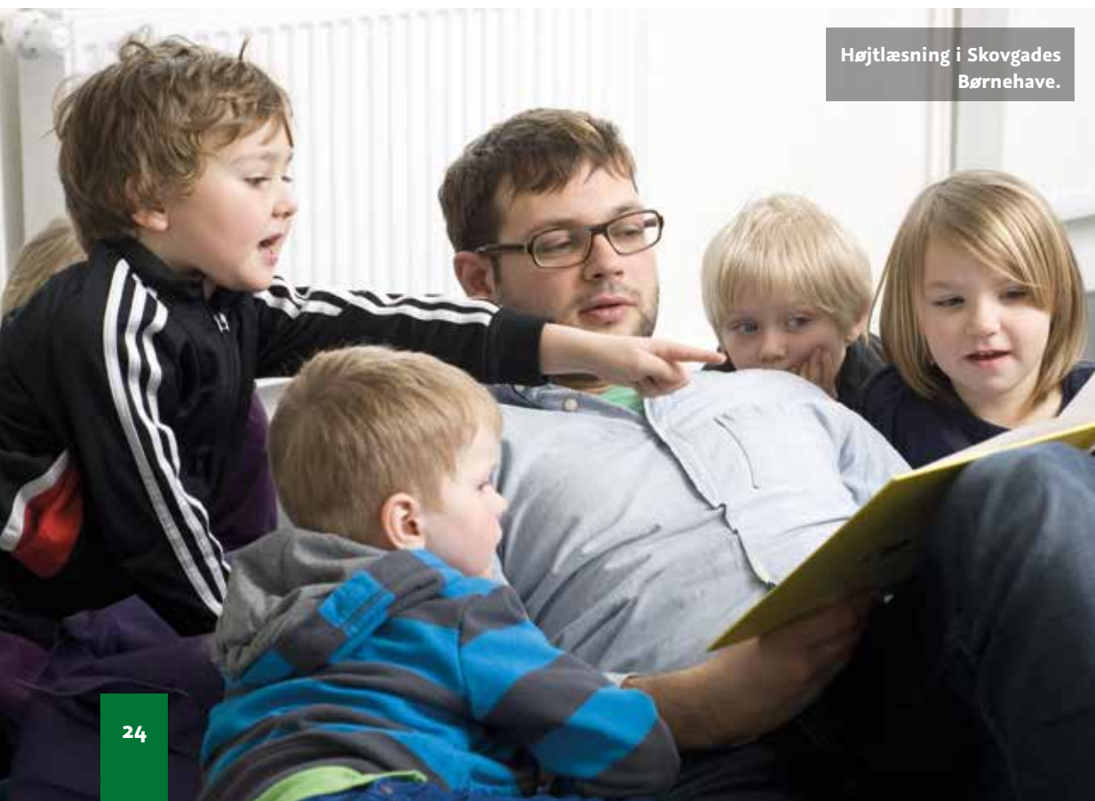
Højtlesning i Skovgades Børnehave.

I sommerferien kunne man i Weekendavisen under overskriften »Solstrålehistorie« læse, at indvandrerbørn er blevet bedre til at mestre dansk, inden de starter i skole. Fremskridtet skyldes pædagogers intensive sprogindsats i daginstitutionerne, og at forældrene spiller med. I den sammenhæng udtaler chefen for afdelingen Børn og Unge i Aarhus Kommune, jeg citerer: