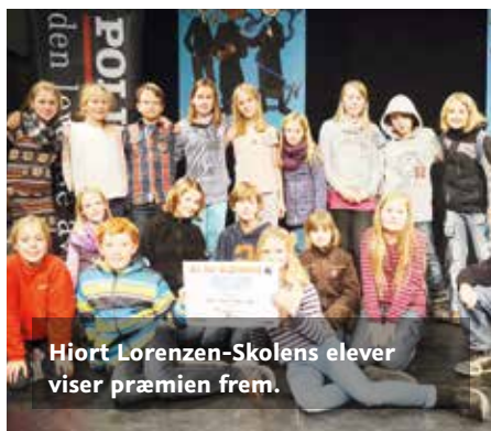
Hiort Lorenzen-Skolens elever viser præmien frem.