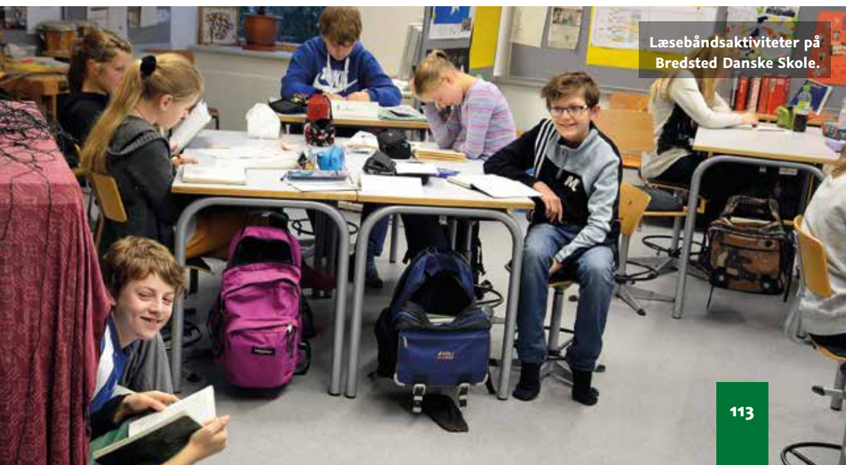
Læsebåndaktiviteter på Bredsted Danske Skole.

Det er klart, at nogle elever kan have svært ved stort set det hele inden for et fag, og nogle elever kan være gode til det hele, men der er først og fremmest mange elever, som er gode til nogle områder i et fag og mindre gode til andre områder. Det er elevernes forudsætninger inden for det