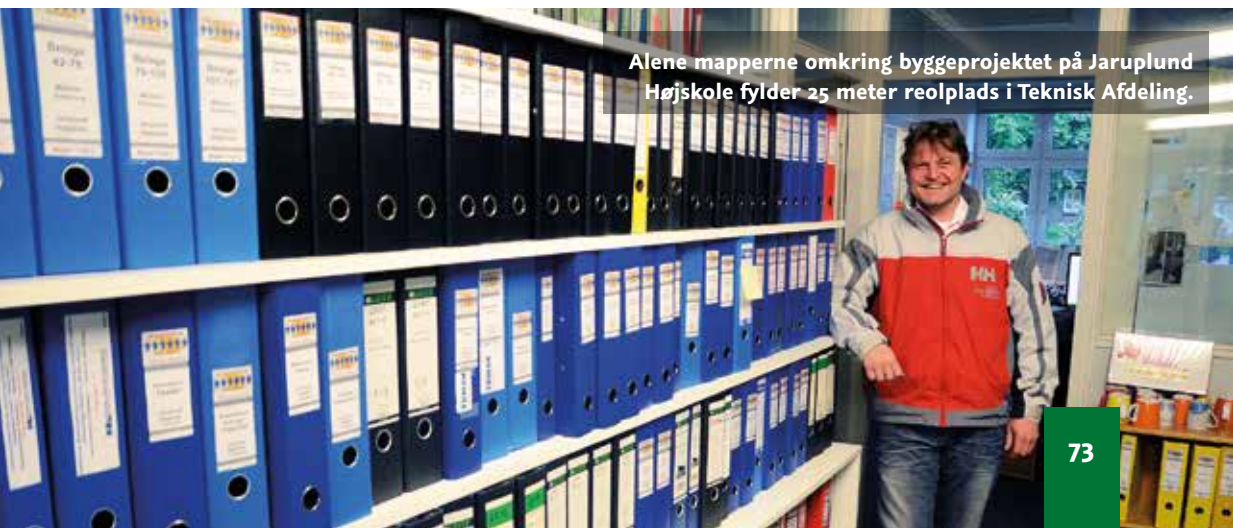
Alene mapperne omkring byggeprojektet på Jaruplund Højskole fylder 25 meter reolplads i Teknisk Afdeling.

Byggefasen er startet. Projektet søges afsluttet inden