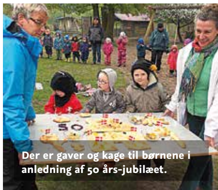
Der er gaver og kage til børnene i anledning af 50 års-jubilæet.

Læk Børnehave fejrer sin 50 års fødselsdag med fest, kage og gaver til alle børnene.