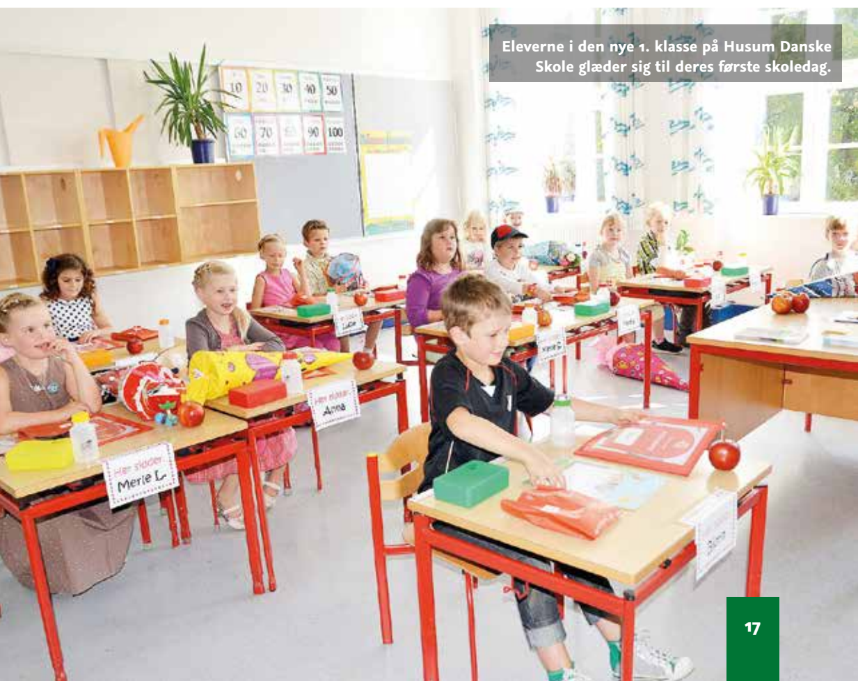
Eleverne i den nye 1. klasse på Husum Danske Skole glæder sig til deres første skoledag.

Nu, hvor de fysiske rammer er ved at være på plads, handler