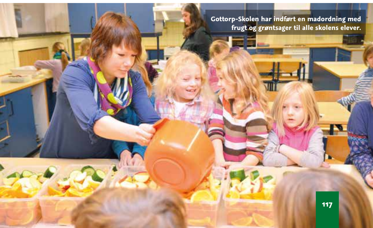
Gottorp-Skolen har indført en madordning med frugt og grøntsager til alle skolens elever.

Det er som nævnt ikke muligt at have tjek på 25 elevers forskellige forudsætninger i mange detaljer eller at tilrettelægge 25 parallelle forløb, men det er muligt at tilrettelægge undervisningen med sigte på typer af forudsætninger og typer af måder at lære på – ud fra lærerens viden og antagelser om de konkrete elever.