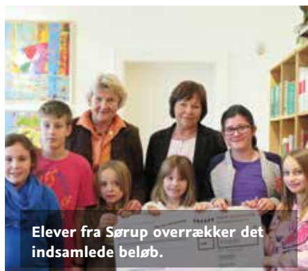
Elever fra Sørup overrækker det indsamlede beløb.

Repræsentanter for UNICEF Flensborg modtager over 6.000,- euro, som Skoleforeningens medlemmer og institutioner har indsamlet til fordel for krigsramte børn i Syrien. Heraf har Sørup Danske Skole indsamlet 823,- euro med en læsemaraton.