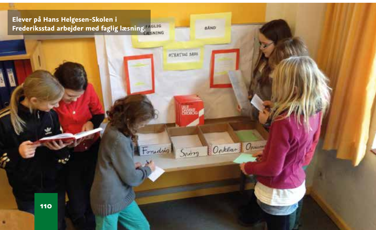
Elever på Hans Helgesen-Skolen i Frederiksstad arbejder med faglig læsning.

Læringsmål skal formuleres tydeligt for at være gode sigtepunkter for læreren og eleverne. I nogle sammenhænge er mål