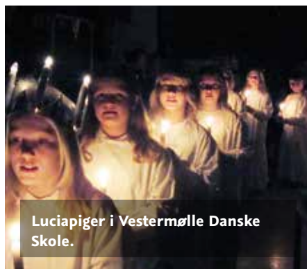
Luciapiger i Vester mølle Danske Skole.

Den traditionelle julekoncert i Slesvig byder på smuk underholdning ved kor fra Hiort Lorenzen-Skolen, Gottorp-Skolen og A. P. Møller Skolen samt Slesvig Folkekor og Slesvig Spejderorkester. Forestillingen høster stort bifald i en stuvende fuld Pauluskirke.