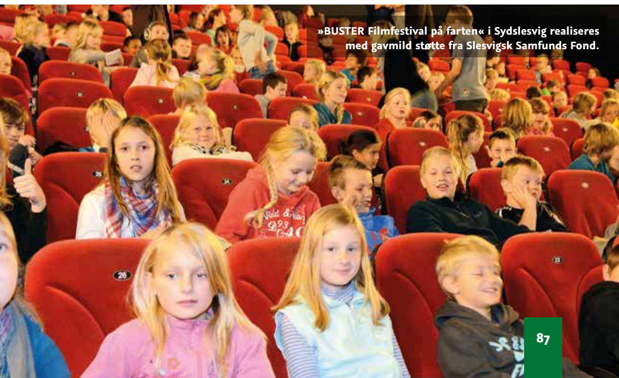
»BUSTER Filmfestival på farten« i Sydslesvig realiseres med gavmild støtte fra Slesvigsk Samfunds Fond.

Skolebibliotekerne er igen i 2013-2014 blevet tilbudt en række velkendte arrangementer til styrkelse af elevernes læselyst og læsefærdigheder. Derudover er der for anden gang blevet gennemført »BUSTER Filmfestival på farten«, den særlige