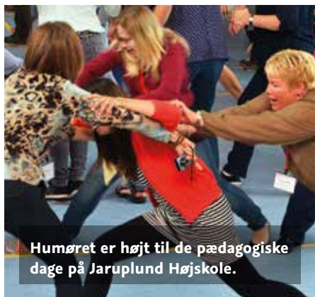
Humøret er højt til de pædagogiske dage på Jaruplund Højskole.

Pædagogerne i Skoleforeningen holder pædagogiske dage; i år er det samarbejde og arbejdsglæde, der står på skemaet til arrangementet på Jaruplund Højskole.