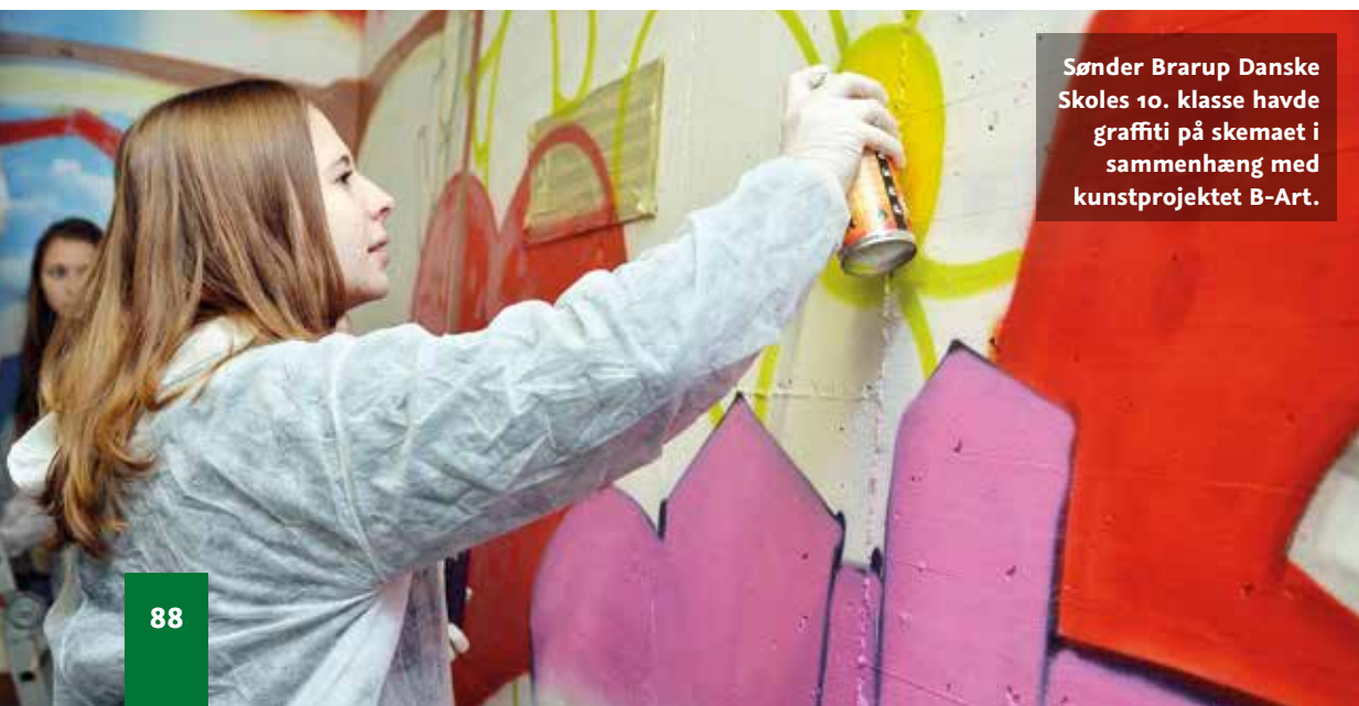
Sønder Brarup Danske Skoles 10. klasse havde graffiti på skemaet i sammenhæng med kunstprojektet B-Art.

Ud over en række veletablerede arrangementer, som kan ses i »Skolebibliotekernes årshjul« på CfU's hjemmeside, planlægges i skoleåret 2014-2015 et nyt projekt, »Nøjh – det er for børn«, i anledning af 50-års-jubilæet for produktion af DR-børneudsendelser.