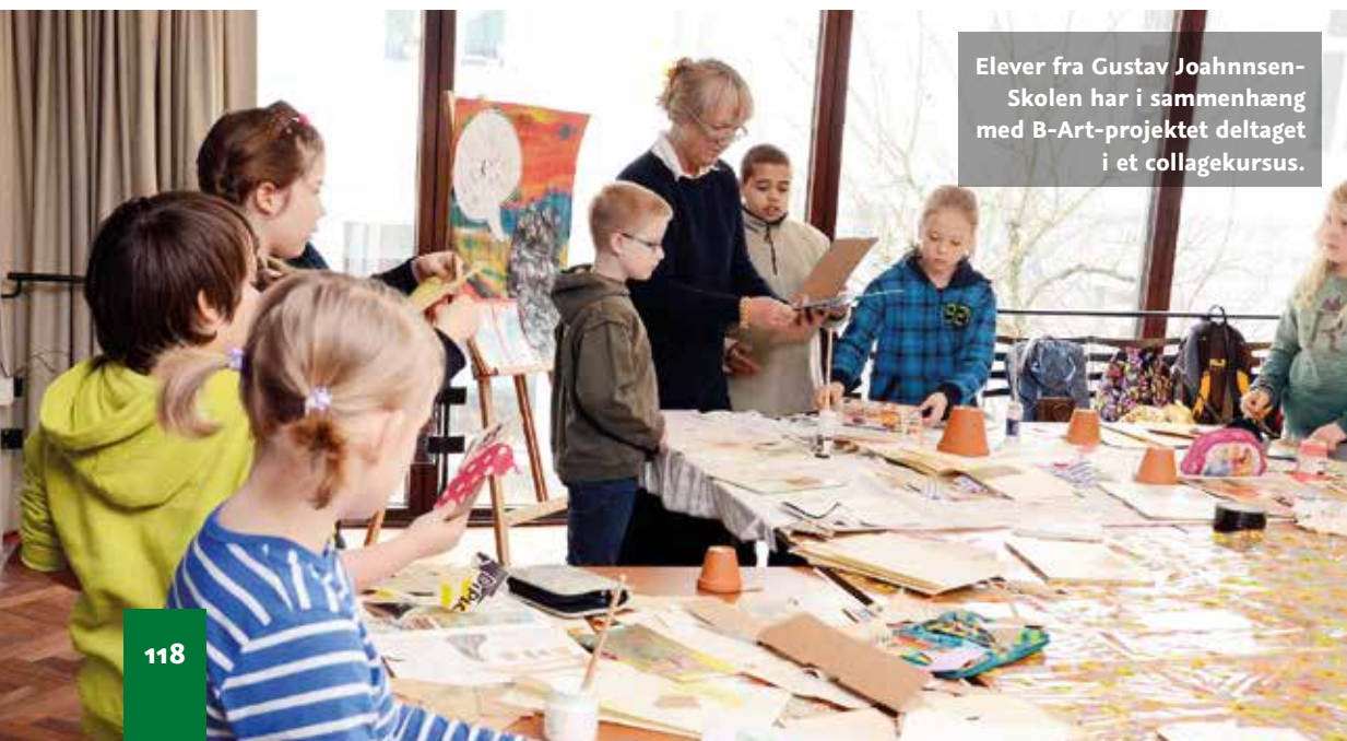
Elever fra Gustav Joahnsen-Skolen har i sammenhæng med B-Art-projektet deltaget i et collagekursus.

Når læreren tilrettelægger et undervisningsforløb og vælger opgaver, skal de som det ene passe godt til de læringsmål, der er i det konkrete undervisningsforløb. Samtidig skal de passe