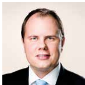
Martin Henriksen Dansk Folkeparti