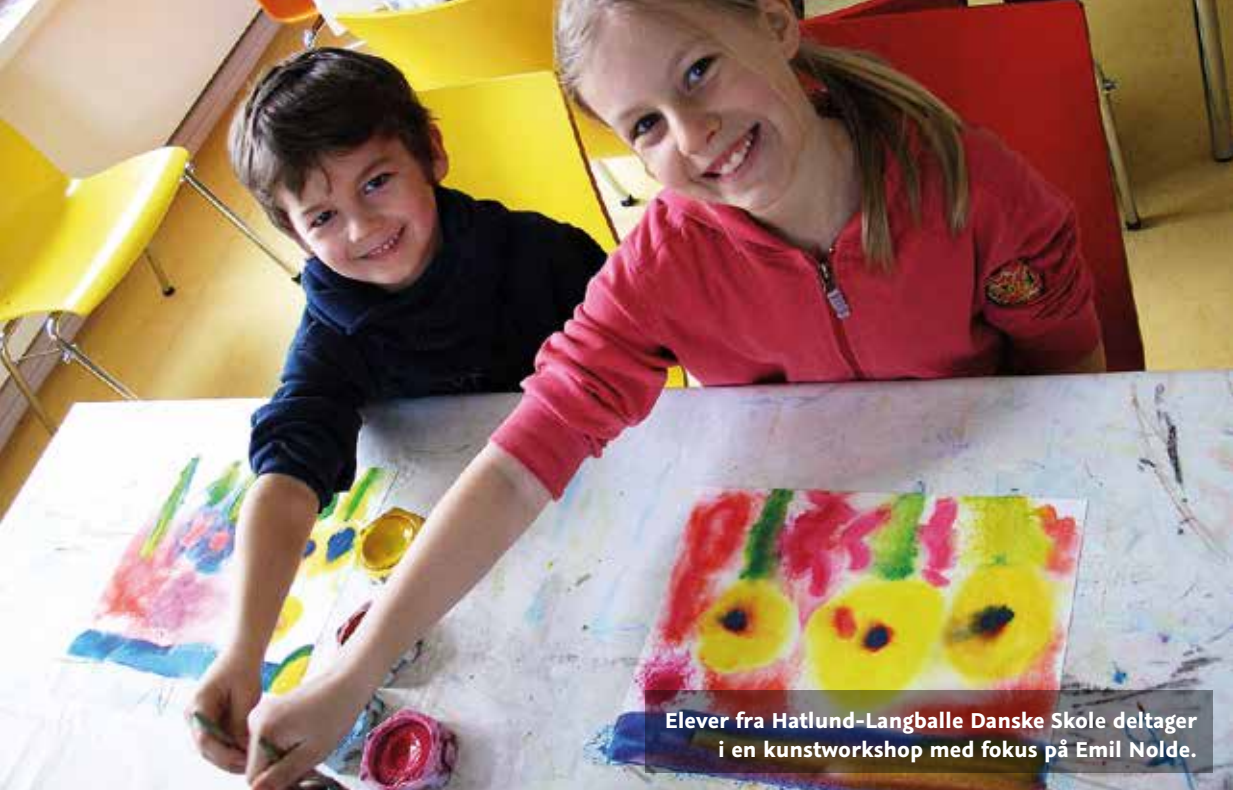
Elever fra Hatlund-Langballe Danske Skole deltager i en kunstworkshop med fokus på Emil Nolde.

skelle. I hertugdømmerne skulle man udover elementærfagene dansk og kristendomskundskab blandet andet lære naturlære, naturhistorie, geografi og fædrelandshistorie. Ligeledes skulle man gå i skole hver dag og ikke, som i kongeriget, kun halvdelen af ugens dage. Måske er grundstenen til, at sydslesvigske elever klarer sig godt i de danske studiemiljøer, allerede lagt for 200 år siden? Samspillet mellem fortid, nutid og fremtid udgøres af mange tråde; men vi må holde fast i, at historiebevidsthed er afgørende for, at vi kan forstå os selv som et nulevende mindretal af mennesker, der er historieskabte og historieskabende.