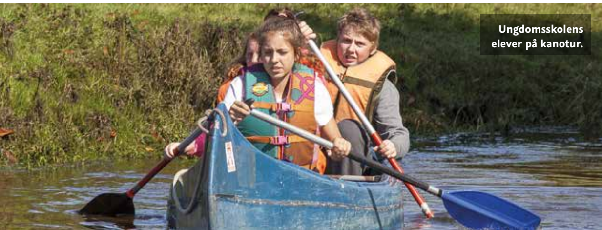
Ungdomsskolens elever på kanotur.

Endelig har jeg godt nyt om kampen mod rygning. Det er en kamp, som lå i naturlig forlængelse af den kamp mod stoffer og alkohol, som vi vandt for næsten ti år siden. Vi kan nu sige, at skolen er stof- og alkoholfri med undtagelse af ganske få episoder siden dengang. Rygning, derimod, har været virkelig svært at komme til livs. Vi har gennem årene arbejdet med positive indfaldsvinkler, og vi har da også nedbragt rygerandelen fra ca. 90 % til 30 %. Nu har vi så valgt at gå mere rabiatic til værks. Hvis